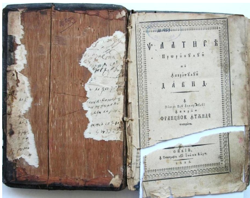
Fig. 1. Prima filă a volumului cu evidențierea degradărilor mecanice înainte de restaurare.