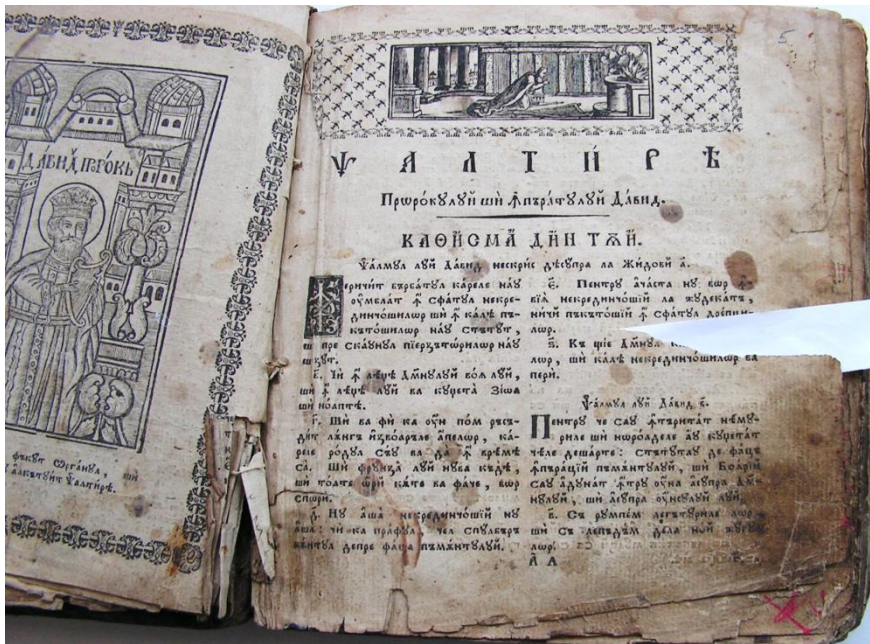
Fig. 3. Murdărie aderentă, pete de ceară și cerneală, rupturi, fisuri, înainte de restaurare.