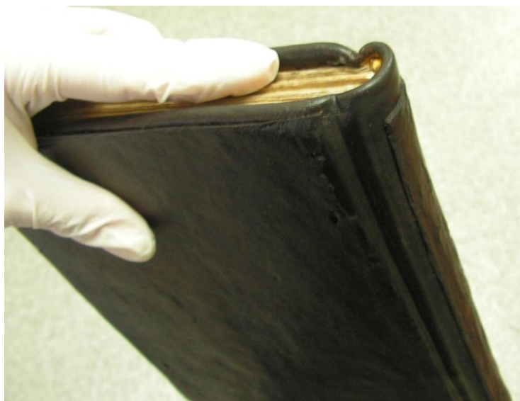
Fig. 6. Cotor exterior, după restaurare.