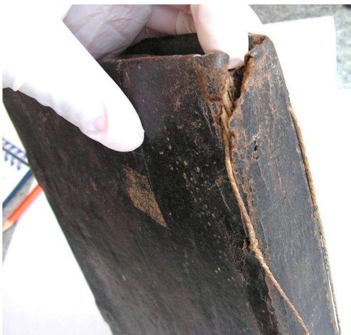
Fig. 5. Cotor exterior, înainte de restaurare.