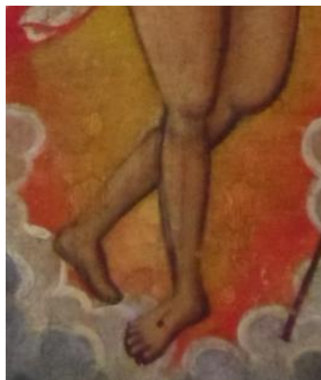
Fig. 4. Lacuna integrată cromatic.