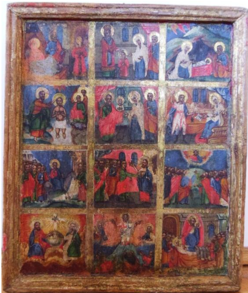
Fig. 5. Ansamblu reprezentând Dodecaortion după restaurare.

Verniul de damar 12% + ceară 1%, ca plastifiant, s-a aplicat prin pensulare și egalizat îndelung. El are ca rol protejarea suprafețelor pictate de factorii nocivi ai mediului ambiant.