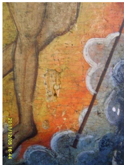
Fig. 2. Lacuna curățată.