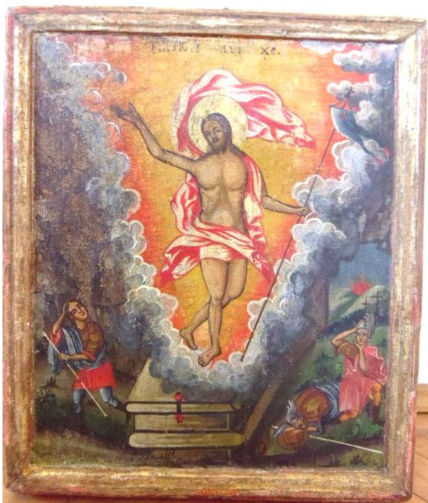
Fig. 6. Ansamblu reprezentând Învierea după restaurare.

Concluzii. Dorim să atragem atenția în primul rând asupra importanței cercetării științifice, pluridisciplinare înaintea începerii intervențiilor de conservare-restaurare, elementele privind tehnica de realizare, morfologiile specifice proceselor de degradare sau intervențiile suferite anterior fiind definitorii în alegerea metodelor de conservare-restaurare adecvate.