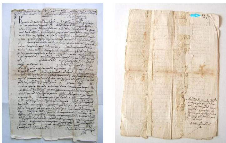
Fig. 3. Marcarea manuscriselor.

La armele de foc numărul se aplică utilizând vopsea albă de email pe placa declanșatorului; armele albe - pe mâner sau etichetă, ce se agață cu ajutorul unei sfori (Fig. 4); armele defensive (coif, caschetă, scut etc.) - pe partea interioară.