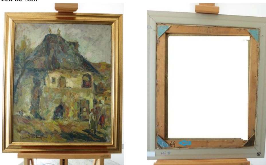
Fig. 1. Marcarea picturilor.

Pictura se marchează cu vopsea pe cadru, în spate, în colțul stâng de jos sau de sus (Fig. 1); pictura neînramată - pe bordură în spate, în colțul stâng de jos. Picturile mari se marchează atât în partea de jos, cât și în cea de sus.