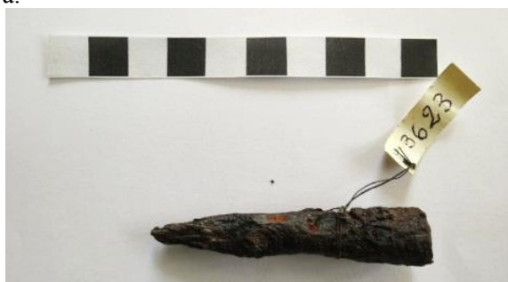
Fig. 4. Marcarea unui bolț de arbaletă.

La armele de foc numărul se aplică utilizând vopsea albă de email pe placa declanșatorului; armele albe - pe mâner sau etichetă, ce se agață cu ajutorul unei sfori (Fig. 4); armele defensive (coif, caschetă, scut etc.) - pe partea interioară.