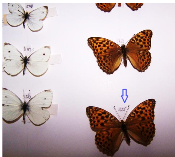
Fig. 6. Marcarea pieselor entomologice.

Încercarea noastră susceptibilă de ameliorări vrea să puncteze încă unul din elementele semnificative care să sporească eforturile depuse pentru ocrotirea și conservarea cât mai judicioasă a bunurilor culturale, mărturii ale existenței noastre.