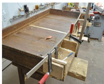
Completări și stabilizare, încleiere suport.