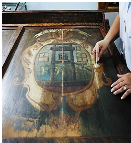
Curățire și integrare pictură.