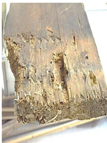
Stare precară de conservare.