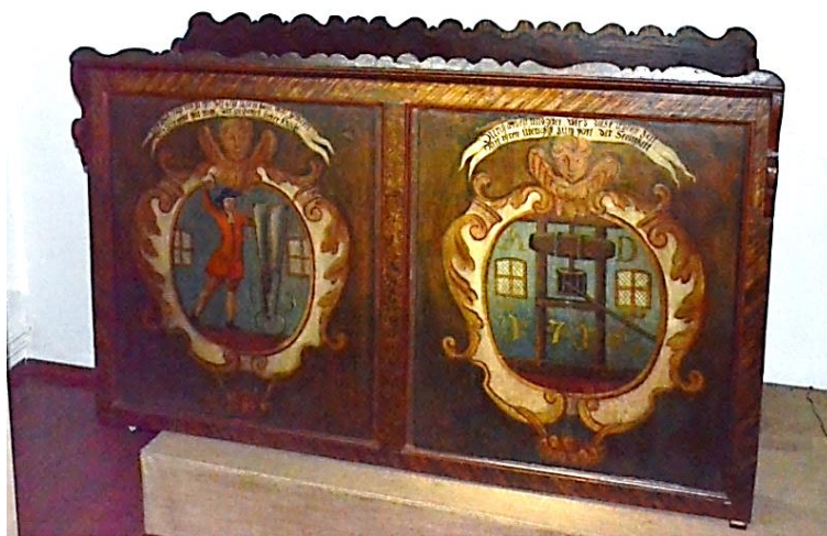
Piesa după restaurare.