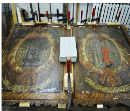
Îndreptare și înclieiere tăblii.