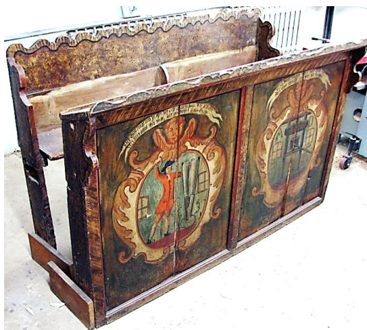
Piesa înainte de restaurare.