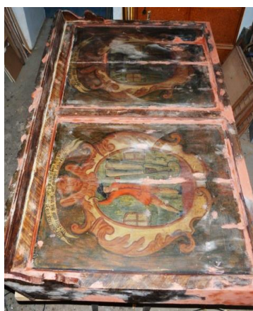
Operațiuni de chituire și șlefuire.