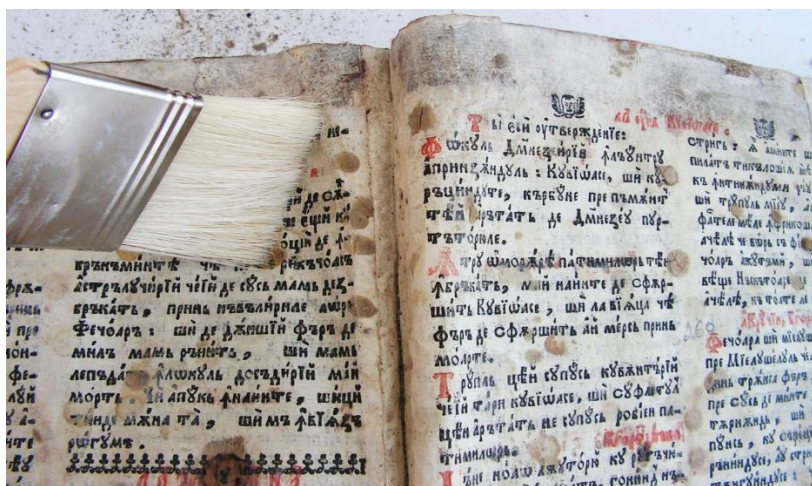
Curățirea uscată: desprăfuire – îndepărtarea depozitelor de praf, ceară, păr, clei, fragmente vegetale.

Din cauza unui microclimat necorespunzător elementele componente ale volumului, cele care alcătuiesc legătura (sfoară, adeziv, ață de coasere) s-au degradat, ceea ce a dus în final la deformarea cotorului interior. Capitalbandurile lipsesc.