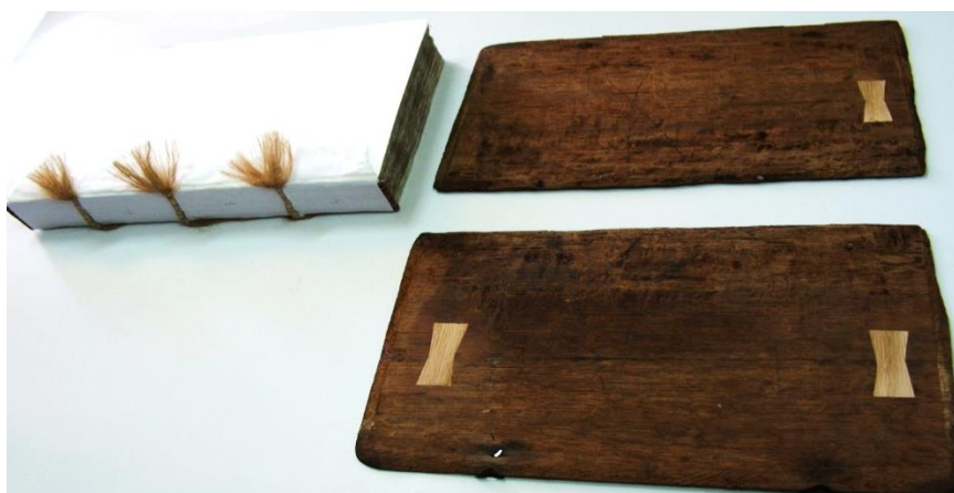
Corpul cărții și scoarțele, după restaurare.