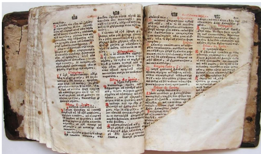
Categorie: Carte veche românească; Loc publicare/tipărire: An de apariție: 1774; Paginație: 292 file; Nr. Rânduri: 40 pe 2 coloane.