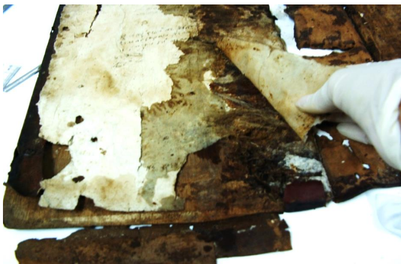
Multiple degradări prezente în scoarța și forțașul cărții.