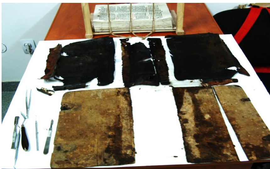
Degradări: rupturi, plieri, pete de apă, patină vulgară, fisuri ale scoarțelor și învelitoarei etc.