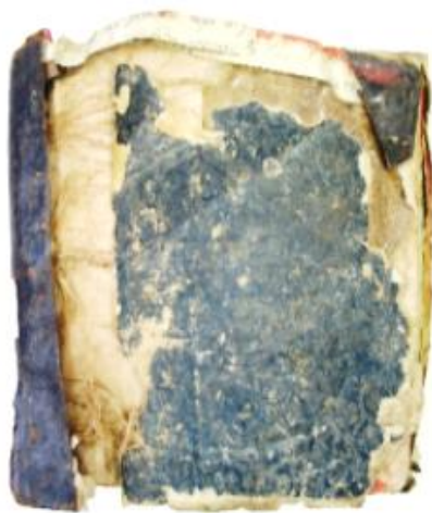
Fig. 1 Se evidențiază desprinderea elementelor legăturii la coperta anterioară, pierderea scoarței.

Degradările fizico-mecanice produse asupra blocului de carte constau în deteriorări ale tranșei frontale și colțurilor, în special la filele de început, dar și importante zone lacunare din cuprinsul său. Gradul ridicat de umiditate, dar de scurtă durată la care a fost expus volumul, a dus la desfacerea elementelor legăturii, cu desprinderea pielii cotorului de scoarțe și pierderea acestora din urmă, păstrându-se doar foile de căptușire a scoarței posterioare (Fig. 1-2). S-au produs cearcănele de apă ale forțașurilor, fără însă ca filele corpului de carte să aibă de suferit. Paginile detașate de volum au fost găsite prinse între ele prin depozite groase de pământ întărit.