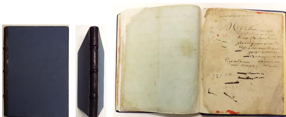
Fig. 7, 8. Legătura exterioară după restaurare.