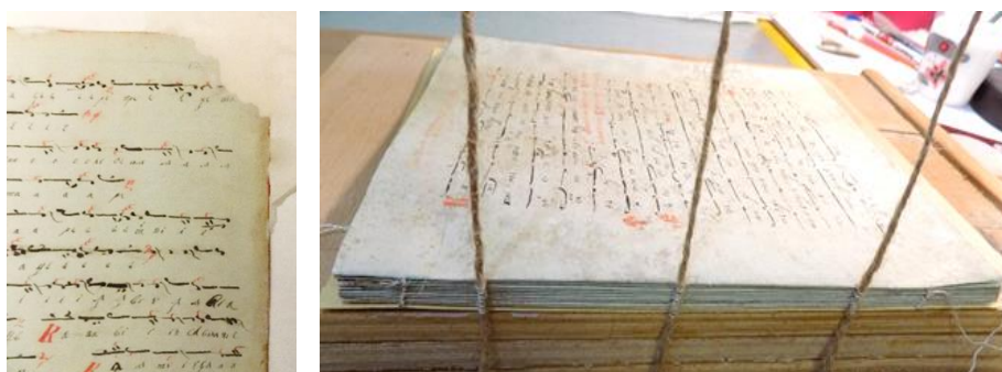
Fig. 5, 6. Aspecte intermediare ale restaurării: completarea zonelor lacunare produse de rozătoare și coaserea fasciculelor la gherghef.

Restaurarea filelor manuscrisului, a părților libere ale forzașurilor și a filelor detașate s-a efectuat prin construirea de aripioare de prindere a filelor desprinse și completarea zonelor lacunare, folosindu-se hârtie japoneză mai groasă în metoda „la dublu”, datorită grosimii hârtiei (Fig.5). S-au croit forzașuri noi, iar părțile libere ale forzașurilor au fost păstrate și atașate corpului de carte prin aripioare, cel posterior prezentând diferite însemnări pe ambele părți (Fig.9). După restaurare, filele individuale au fost grupate separat într-un pachet ce urmează să fie lăsat împreună cu volumul.