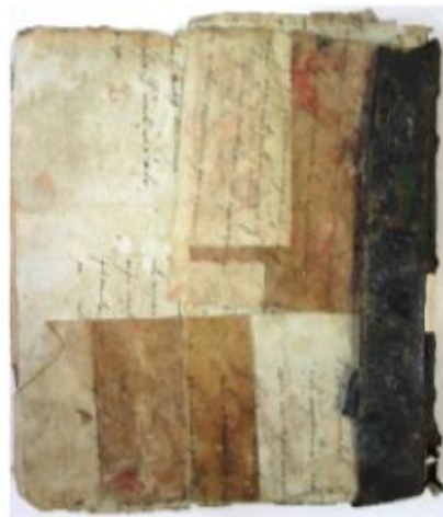
Fig. 2 Din coperta posterioară s-au păstrat doar fragmentele de căptușire a scoarței.