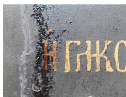
Depuneri aderente pe stratul pictural.

La nivelul suportului au putut fi identificate o serie de fisuri, degradări cauzate de factori mecanici datorate cuielelor de fixare a ferecăturii și coroanelor atașate acesteia.