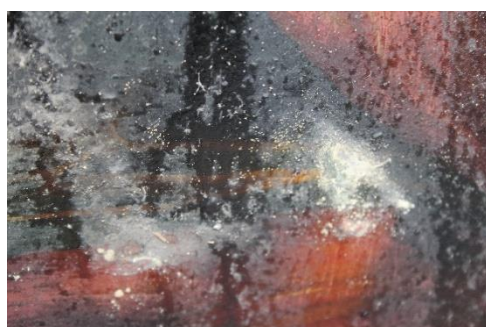
Eroziuni la nivelul peliculei de vernis și stratul cromatic cauzate de ferecătură.