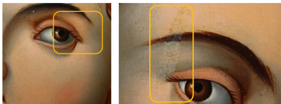
Îndepărtarea repictărilor și parțial a vernisului deteriorat.