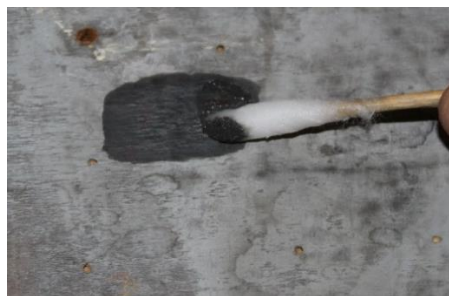
Curățare verso cu apă alcoolizată.