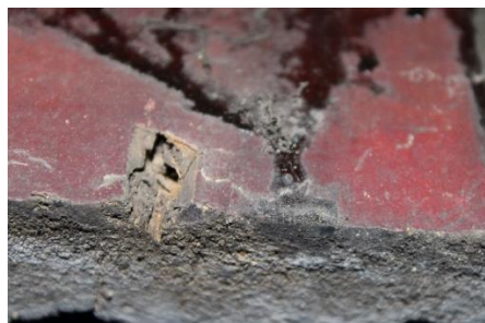
Lacune în suport.