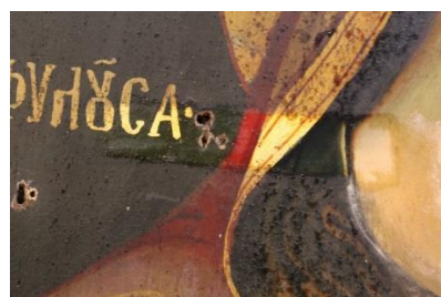
Probe de curățare pe pelicula picturală.