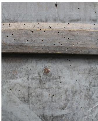
Orificii de zbor pe versoul icoanei.