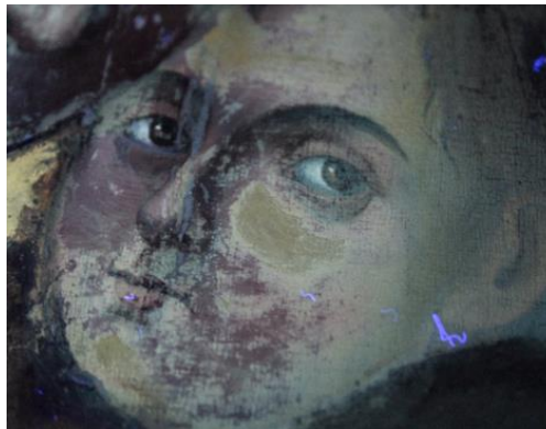
Observarea repictărilor în lumină cu ultraviolete.