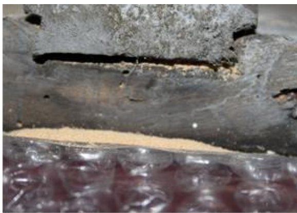
Rumeguș din orificiile de zbor.

În zona chipurilor în special, se observă existența unor repictări ce au putut fi puse în evidență de lumina ultravioletă. Iconarii au alternat tehnica pastiglia pe veșminte cu modeleuri fine, transparente de culoare aplicate în straturi subțiri. Din cauza variațiilor de temperatură și umiditate, acestea au determinat contracțiile și dilatățile masei lemnoase, fenomenul determinând apariția la nivelul stratului pictural a unei rețele de microfisuri longitudinale.