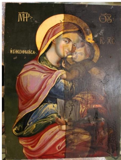
Efectuarea operațiunilor de curățare.

Pe verso orificiile de zbor, de cuișe și fisurile au fost obturate cu un amestec de praf de lemn și clei de sturion 8%.