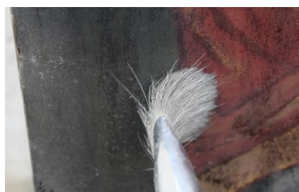
Desprăfuirea stratului pictural.