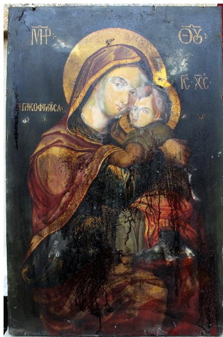
Icoana înainte de restaurare.