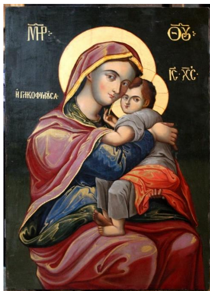
Icoana după restaurare.