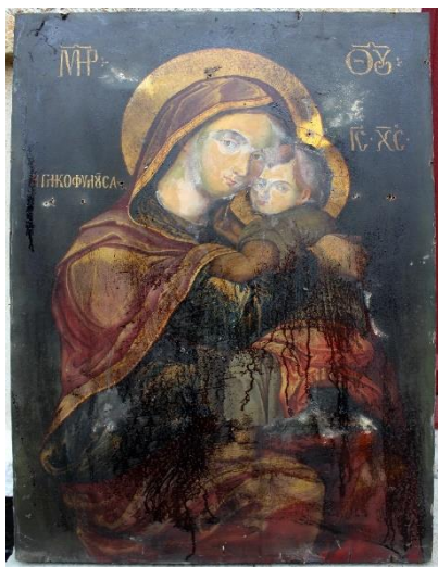
Icoana înainte de restaurare.

Biocidul folosit a fost Per-xil (permetrină și piperonylbutoxid). Acesta a fost injectat în orificiile de zbor ale insectelor xilofage. Injectarea a fost urmată de o pensulare a biocidului pe toată suprafața lemnoasă, având grijă ca biocidul să nu ajungă pe stratul pictural. După ce biocidul a fost absorbit de lemn, obiectul a fost sigilat cu folie de plastic pentru a nu permite biocidului să se evapore. După 14 zile obiectul a fost desigilat și s-au repetat cele două teste pentru a verifica eficiența biocidului. Atacul a devenit inactiv.