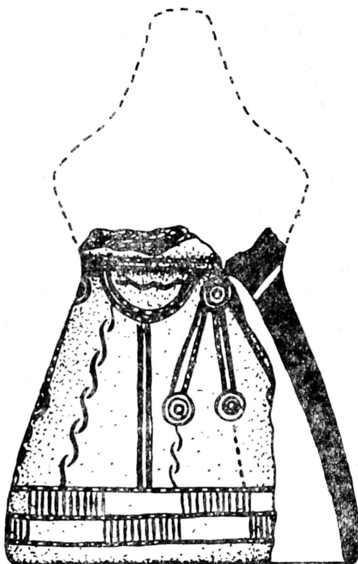
PL. I. Fragment figurină. Piatra Elişovei .