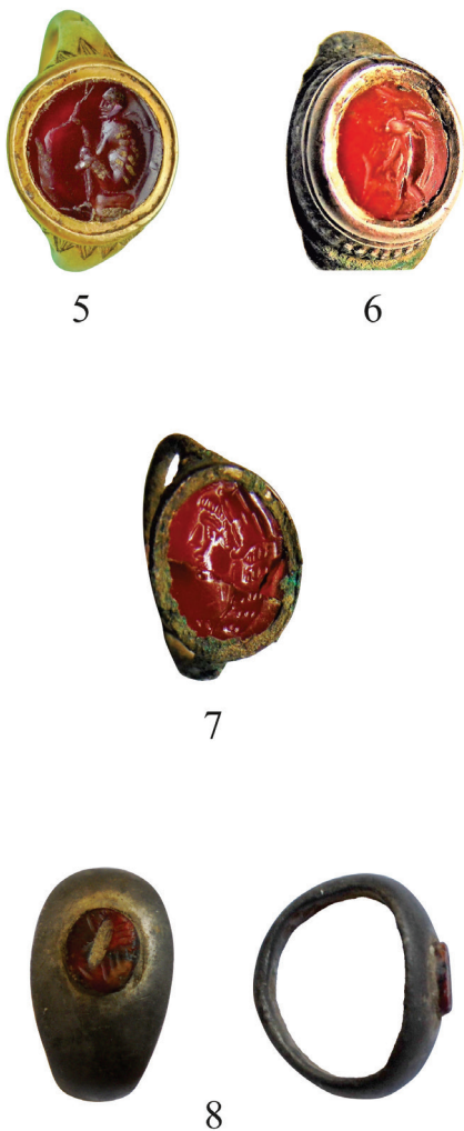
Pl. 3. 5. Gemă descoperită la Aluniș-Căpreni, nr. cat. 5, fotografie V. Marinoiu. / Roman gem discovered in Aluniș-Căpreni, no. cat. 5, personal photo V. Marinoiu. 6. Gemă descoperită la Aluniș-Căpreni, nr. cat. 6, fotografie V. Marinoiu. / Roman gem discovered in Aluniș-Căpreni, no. cat. 6, personal photo V. Marinoiu. 7. Gemă descoperită la Aluniș-Căpreni, nr. cat. 7, fotografie V. Marinoiu. / Roman gem discovered in Aluniș-Căpreni, no. cat. 7, personal photo V. Marinoiu. 8. Gemă descoperită la Drăguțești, nr. cat. 8, fotografie V. Marinoiu. / Roman gem discovered in Drăguțești, no. cat. 8, personal photo V. Marinoiu.