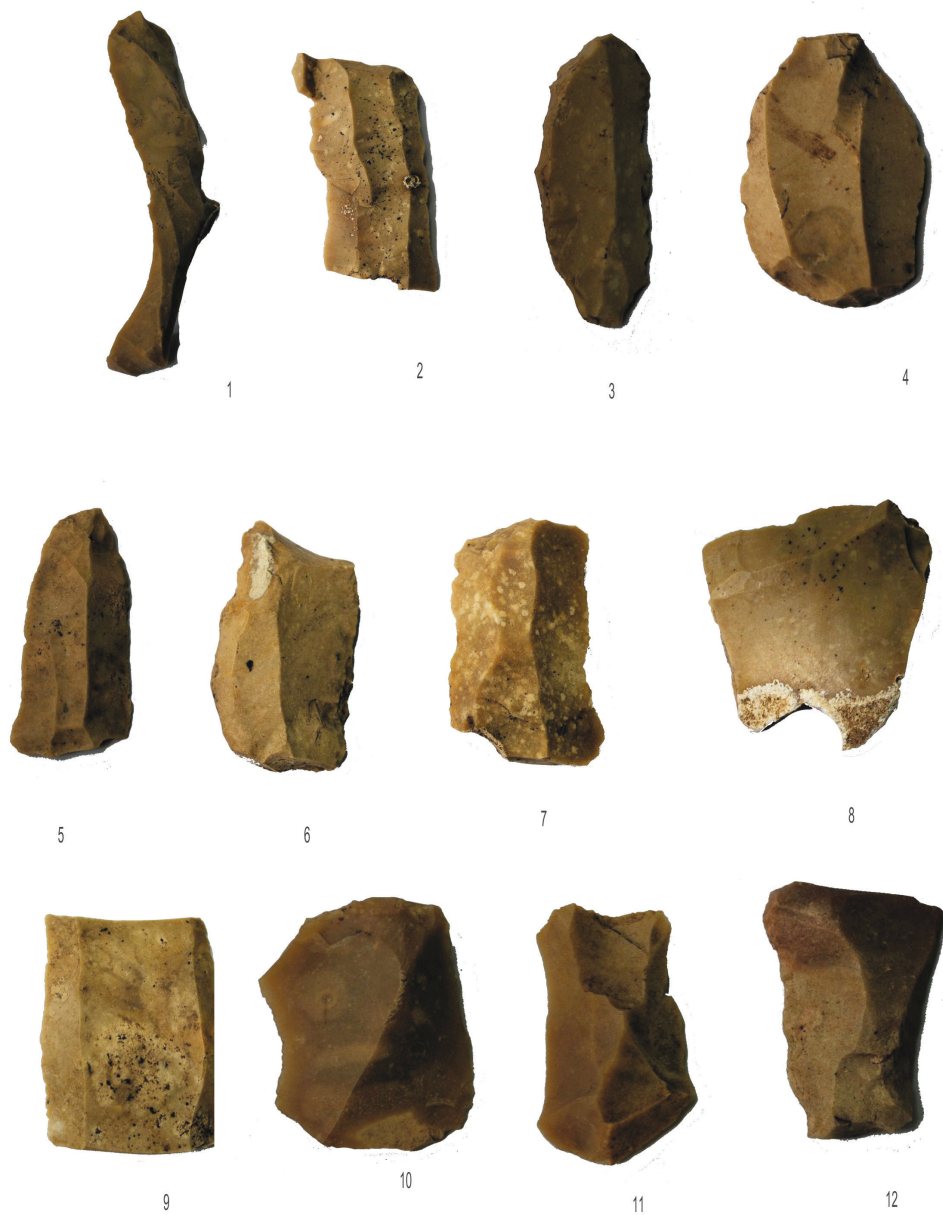
Pl. 2. Dobrosloveni – „La Fântâna lui Păun”: 1-12 – Unelte de silex. / Dobrosloveni – „La Fântâna lui Păun”: 1-12, Silex tools.