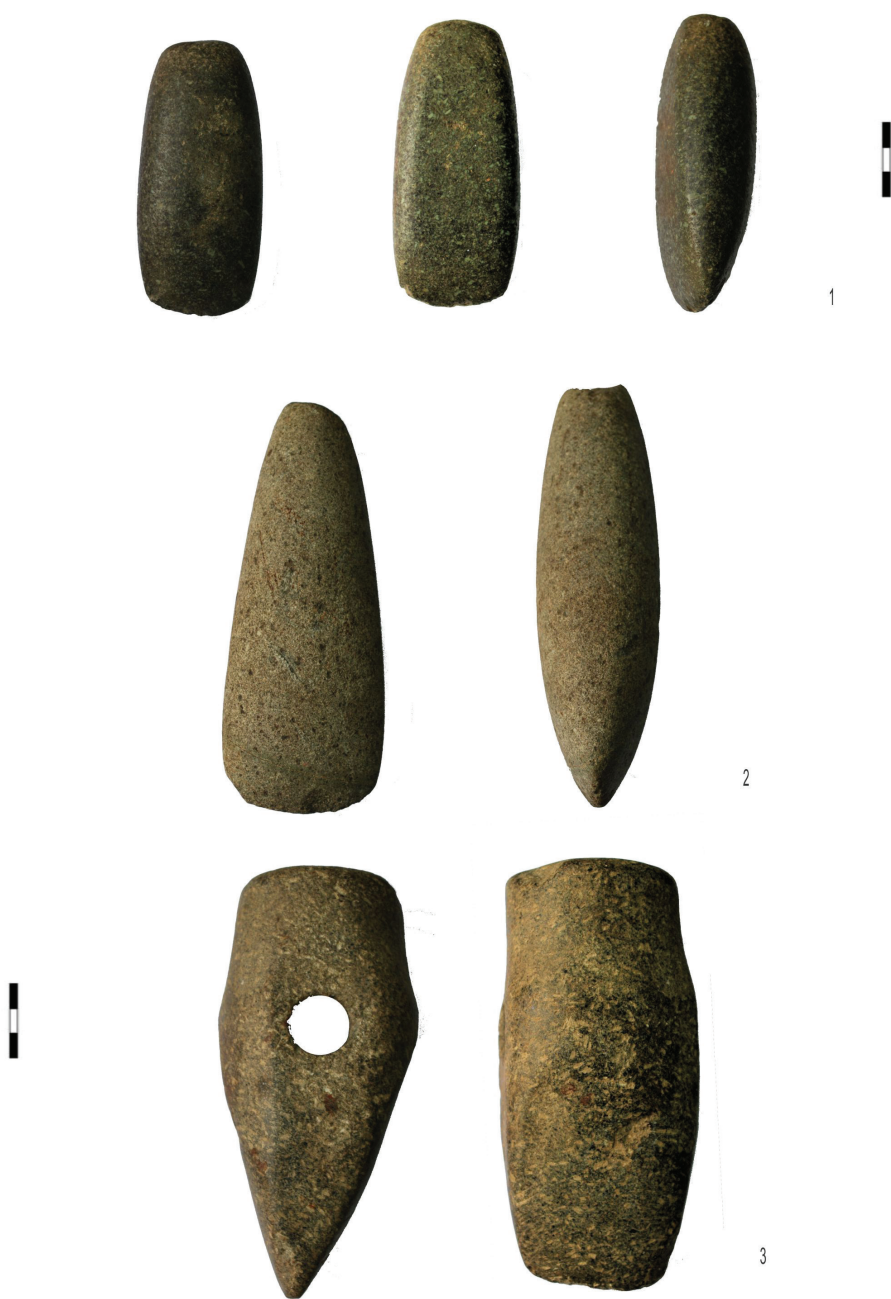
Pl. 1. Unelte de piatră (topoare): 1. Grădinile; 2. Dobrosloveni; 3. Uria. / Stone tools (axes) 1. Grădinile; 2. Dobrosloveni; 3. Uria.