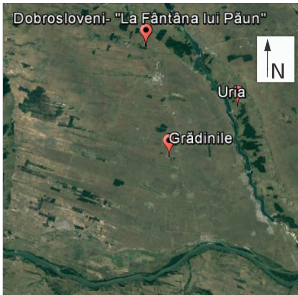
Harta 2. Valea Oltului Inferior: localitățile unde au fost descoperite topoarele. / Map 2. Inferior valley of the Olt: localities where axes were found.