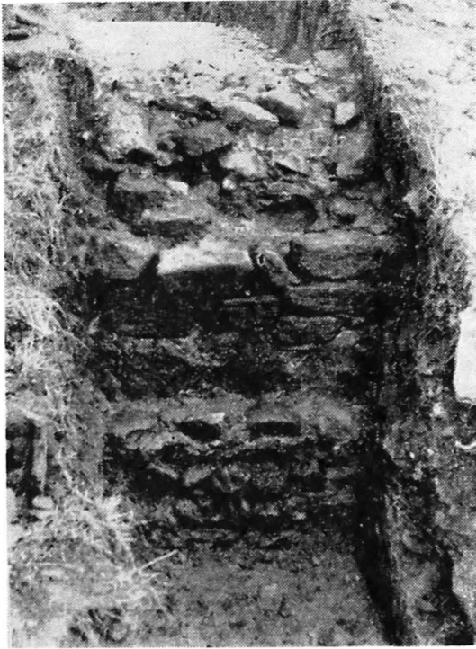
Fig. 3. Secțiunea peste latura de V — aspectul zidului de incintă.

de 0,25 m. El se află deasupra stratului de aluviune antică. Nu este exclus ca stratul de prundiș să reprezinte via sagularis . Cercetările viitoare urmează să stabilească acest lucru.