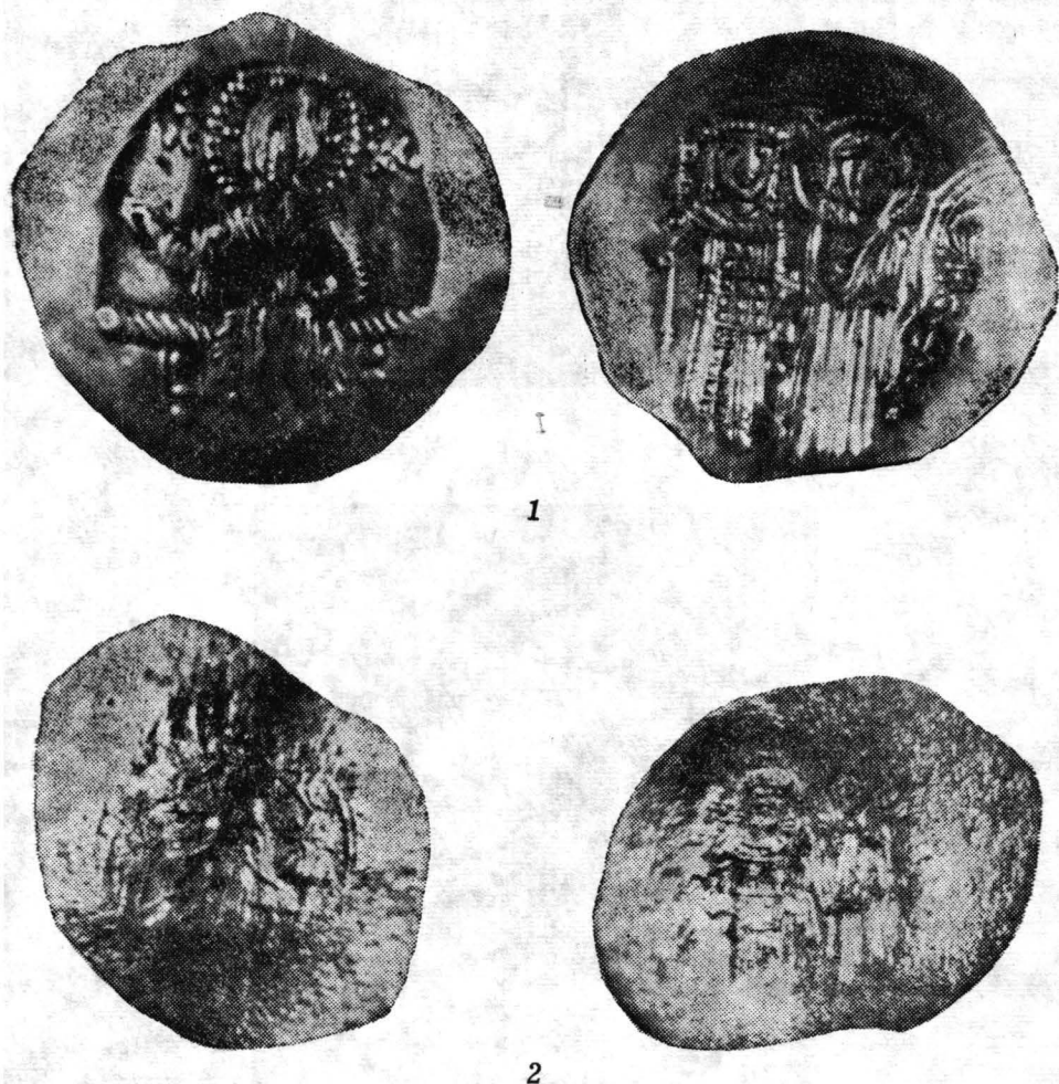
Pl. I — Cuptoare: 1 (C/IV/2) — hiperper 2 — stamenon C/IV/1 (mărite de 2 ori).