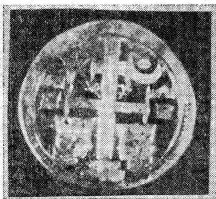
Pl. III — Cuptoare — monede Ștefan V; 1 — (C/IV/7) — dinar; 2 — dinar banal de Slavonia (C/IV/8), mărite de 3 ori.