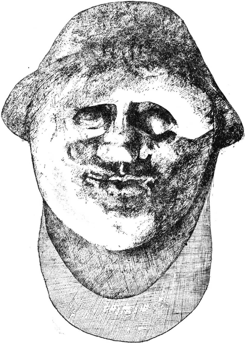
Fig. 3 Cozla — Piatra Elișova. Detalii ale capului.