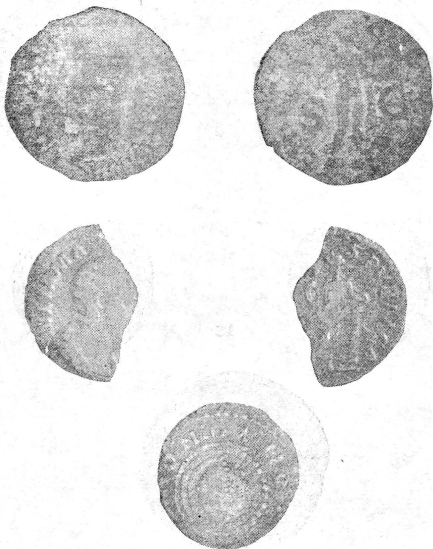
Fig. 3. Monede din colecția Muzeului din Biserica Albă.