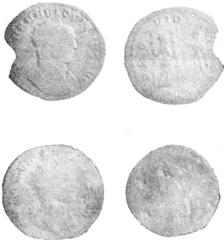
Fig. 4. Monede din colecția Muzeului din Biserica Albă.