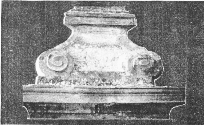
3. Inscripția 3.