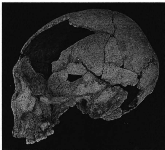
Figura 3. Reconstituire preliminară a pieselor craniene majore Oase 2, la nivelul anului 2004, vedere laterală. Cele trei secțiuni majore, facială, temporal-occipitală și bolta neurocraniană sunt doar alăturate, ceea ce face vizibile micile goluri din regiunea supraorbitală și sutura squamosa. Alte fragmente ale craniului au fost descoperite în anul 2005 și urmează a fi atașate neurocraniului. În cursul acestui proces ar putea, ca urmare, să apară reajustări minore.