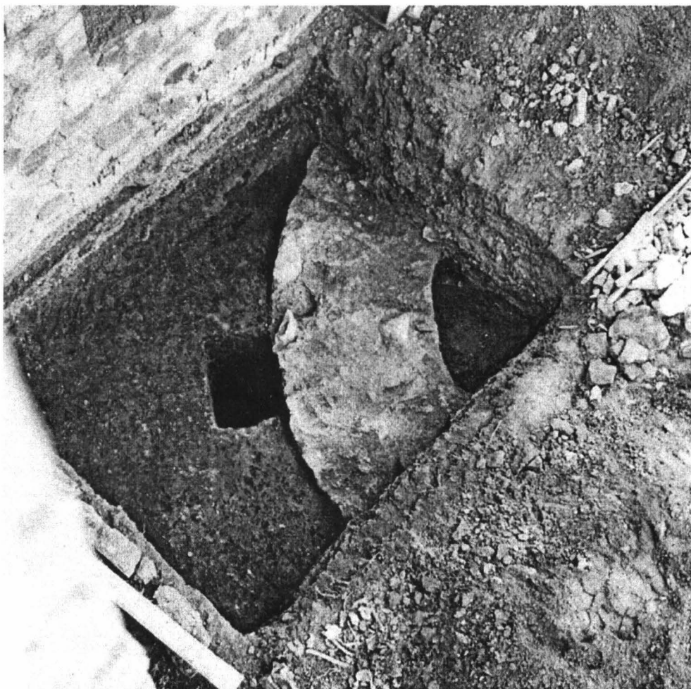
Fig. 2. Vârșeț, Karpatska ul. 20. Vedere a absidei bisericii.