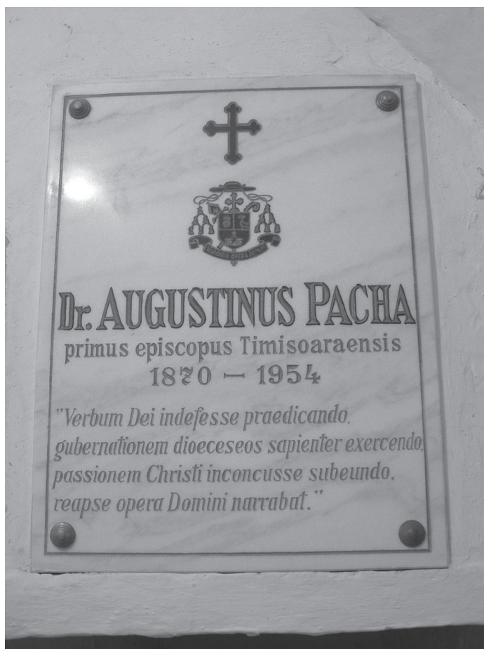
Foto. 3 Piatra funerară a episcopului Augustin Pacha din cripta Domului din Timișoara