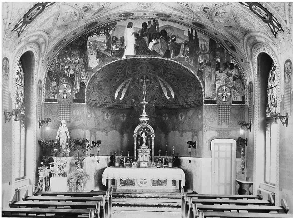
Capela seminarului nou.