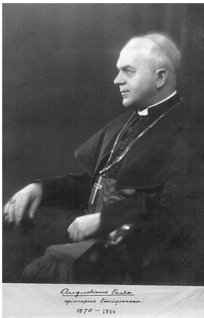
Episcopul Augustin Pacha, fotografie cu autograf (foto circa 1930).