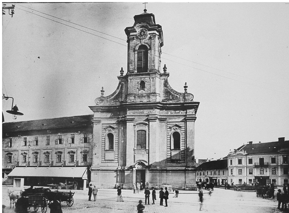
Seminarul Vechi și biserica seminarului.