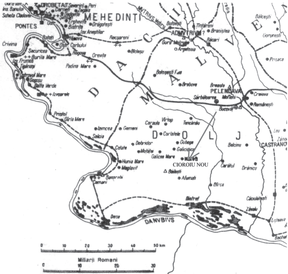
Fig. 1. Cioroiu Nou și împrejurimile pe harta Olteniei romane/ Cioroiu Nou and its surroundings on the map of Roman Oltenia (după D. Bondoc/after D. Bondoc)