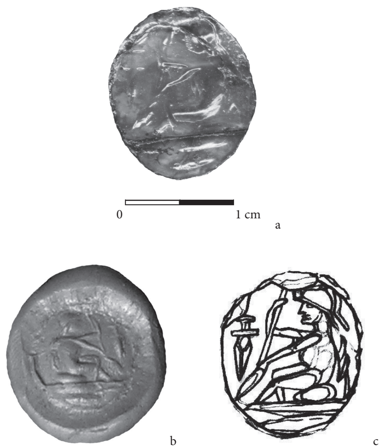
Fig. 3. Piatra gemă care decorează inelul de la Cioroiu Nou, fotografie (a), mulaj (b) și desen (c)/ The gemstone which adorns the ring from Cioroiu Nou, photography (a), clay mould (b) and drawing (c)