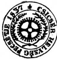
Fig. 4. Cicir. Sigiliul satului Cicir (1837). Sigiliu rotund. În câmpul sigilar, o roată de moară cu palete. Pe margini două ramuri care se unesc în partea inferioară. În exergă, între două cercuri liniare s-a scris legenda cu majuscule în limba maghiară CSICSER HELYSEËG PECSËTJE 1837. Semnificația: roata de moară semnifică practicarea morăritului, în localitate existau mori plutitoare. / Cicir. The seal of the village of Cicir (1837). Round seal. A mill wheel with palletes in the seal filed. Two lateral branches joining down the low level. The Magyar written legend in the exergue: CSICSER HELYSEËG PECSËTJE 1837. Meaning: the mill wheel means milling practice, there were floating mills at Cicir.