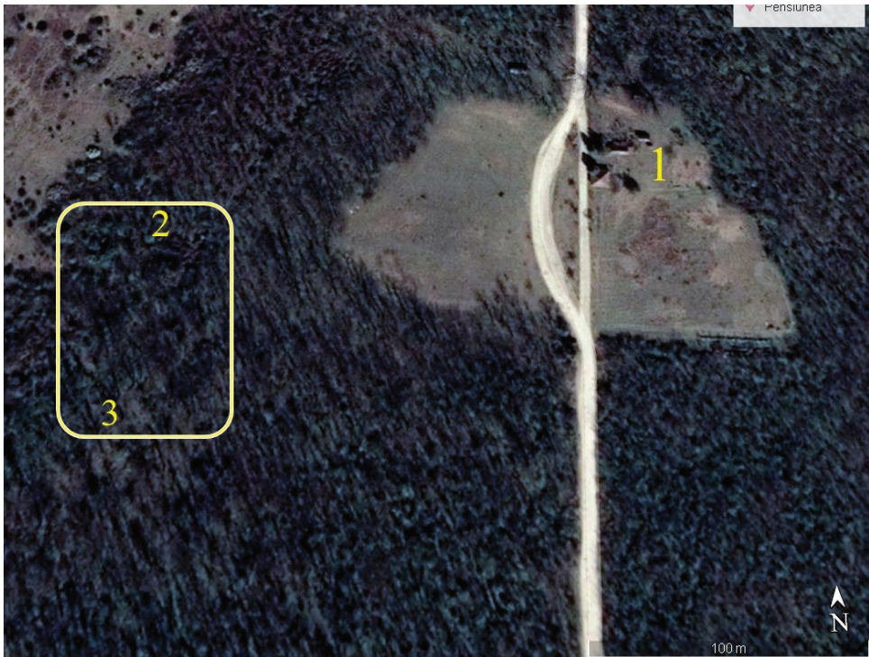
Fig. 5. Cicir – pădure. Canton silvic. Imagine satelitară Google Earth, 4/2020. 1 – canton silvic. 2 – imaginea substrucțiilor fostei biserici a satului Cicir (sec. XVII?). 3 – alte structuri ale fostului sat, contemporane cu edificiul religios. / Cicir – forest. A forestry station. Satelitary image Google Earth, 4/ 2020. 1 – a forestry canton. 2 – image of the fondation of the former church of the village (17 th century?). 3 – other structures of the former village, contemporary with the church.