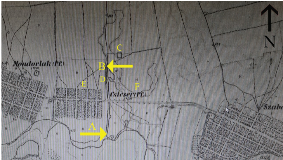
Fig. 3. Cicir. Harta Francisco-Josephinische Landesaufnahme (1869–1887). A-B – traseul Iarcului. C – fortificația de pământ. D – locul de descoperire a debarcaderului de piatră. E – satul Cicir. F – bucla brațului secundar al Mureșului, colmatat. / Cicir. Francisco-Josephinische Landesaufnahme map (1869–1887). A-B – the Iarc tract. C – the ground fortification. D – location of the stone worked landing place discovering. E – the village of Cicir. F – the loop of the Mureș River minor silted branch.