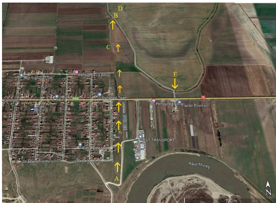
Fig. 1. Cicir. Săgeata indică A-B, traseul „Iarcului”. C – poziția fortificației de pământ. D – locul debarcaderului din piatră. / Cicir. The arrow shows A-B, the tract of the „Iarc”. C – location of the ground fortification. D – location of the landing place.