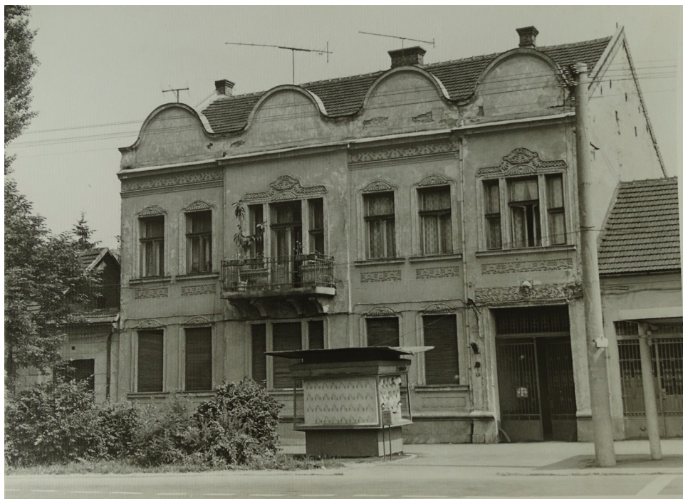
Casa Markovsky (colecția foto MBM, nr. inv. 18957)