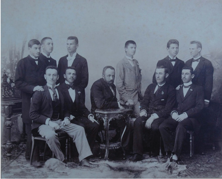
Il. 2. Absolvenți ai Gimnaziului Superior Regal din Arad 13

Bichiș (2 elevi), Caraș-Severin (4 elevi), Cenad (1 elev), Sibiu (2 elevi), Timiș (16 elevi) și Torontal (1 elev) – ei proveneau din familii cu situații materiale diferite – agricultori (14), mici proprietari (5), grădinari (1), brigadier silvic (1), meșteșugar (1), agent comercial (1), funcționari (14), preoți (16), învățători (17), subofițer (1), profesor (1), avocați (2), medici (2), inginer silvic (2), văduve (3). 12