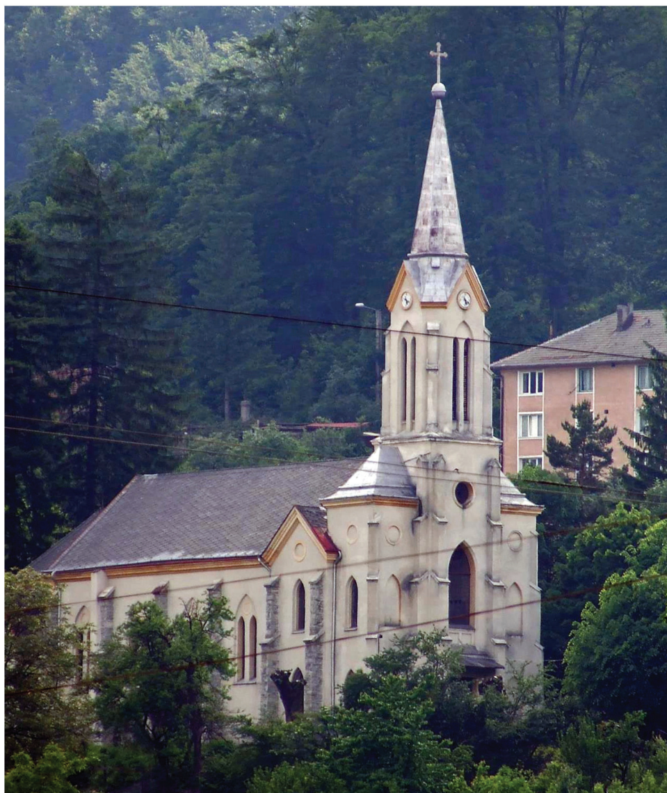
Pl. IV. Biserica romano-catolică din Anina. / The Roman-Catholic Church in Anina.