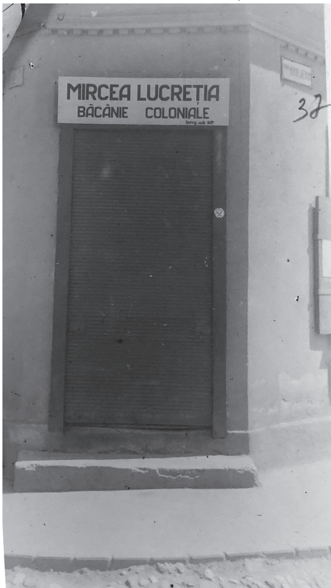
Băcănie coloniale Mircea Lucreția 162