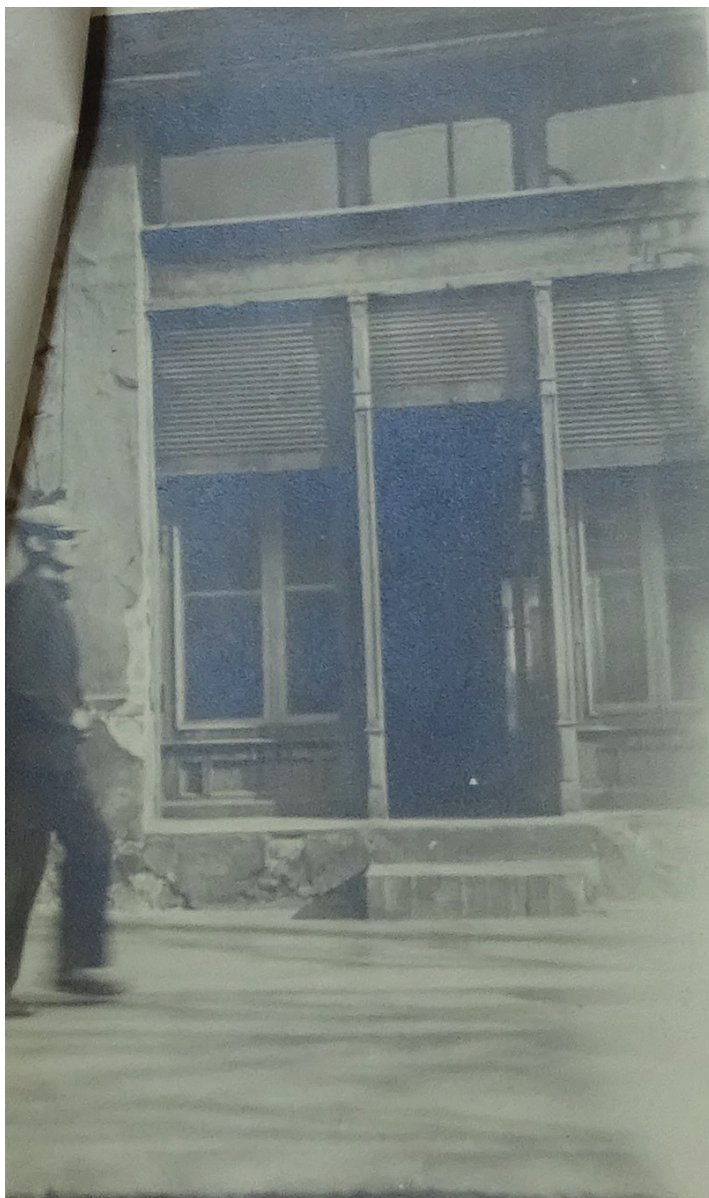
Băcănia Weitzen Rozalia 163