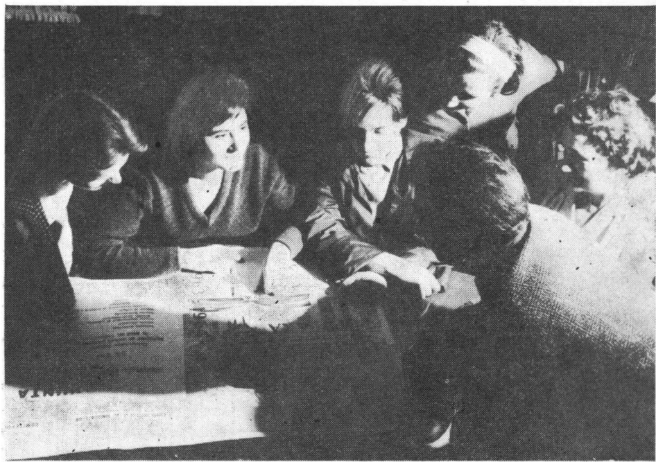
Moment din perioada înscrierilor la Universitatea Populară București.

Această formă permite cursanților să-și aleagă singuri cursurile care-i interesează și să-și completeze cunoștințele fără a-și părăsi locul de muncă.