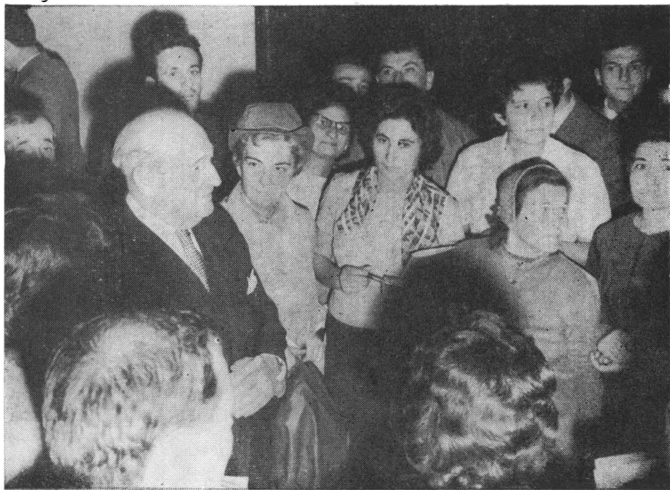
Regretatul Ion Marin Sadoveanu în milocul cursanților săi de la Universitatea Populară București (1963).

Universitatea Populară București care a preluat în anul 1964 și atribuțiile Lectoratului Central, va funcționa în anul școlar 1964—1965 cu 21 de