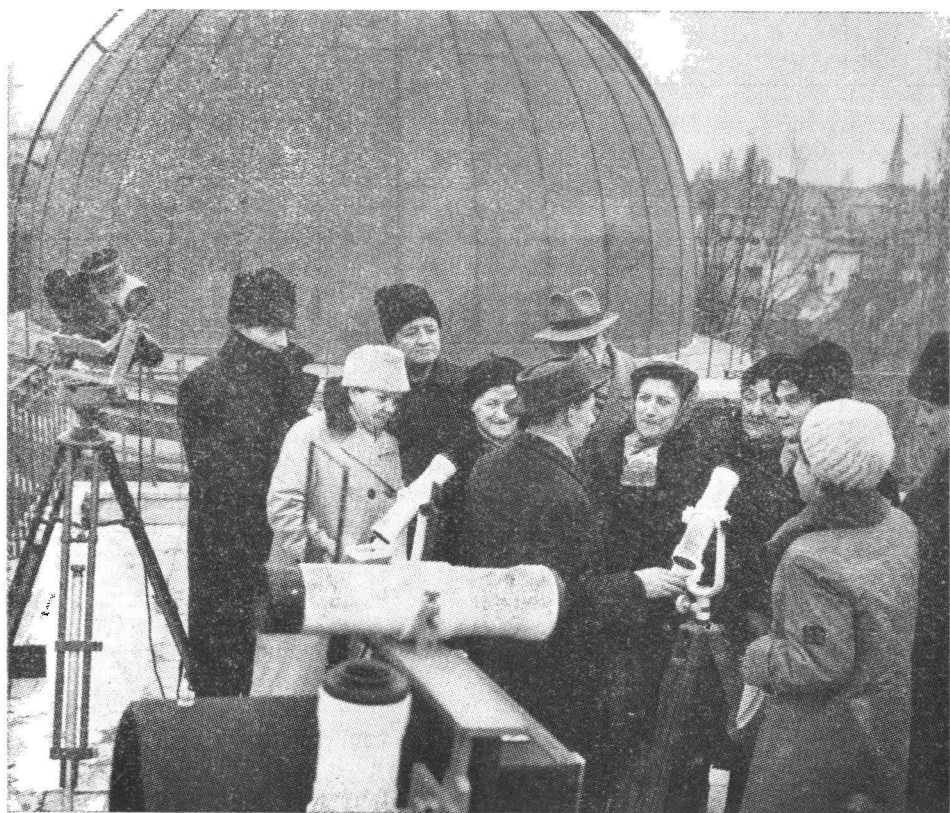
Aplicații practice cu cursanții unei universități populare la Observatorul Astronomic al Academiei R.P.R.

În darea de seamă a universității muncitorești de la Uzinele „Grivița Roșie“, pe anul de învățămînt 1958—1959, se sublinia : „Trebuie să arătăm