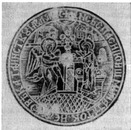
Pecetea orașului pe cartea din 17 iulie 1698 (7206) (Buna Vestire). Tipul II, varianta C.

Făcînd abstracție de această unică dar interesantă excepție, cărțile organelor administrative ale orașului demonstrează o anume autonomie, incompletă însă, a județului cu pîrgarii față de autoritățile domnești, opunînd orașul cu pazarul de o parte, curții domnești pe de alta, în ciuda imediatei lor vecinătăți. Neamestecul unora cu ceilalți este expli-