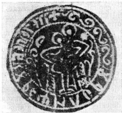
Pecetea orașului pe cartea din 1631—1632 (7140) (Maica Domnului, în întregime, pe tron, cu pruncul pe brațul stîng). Tipul I, varianta C.

Înăuntrul celei de a doua și a treia variante ale primului tip (Maica Domnului cu pruncul pe tron) cunoaștem patru întipăriri, cu diferențe de diametru 3 . Varianta a treia (Maica Domnului pe tron cu pruncul pe brațul stîng), apare pe o carte din 1631—1632, apoi la 23 decembrie