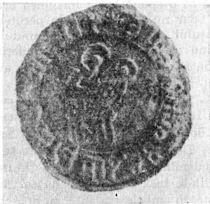
Pecetea orașului pe cartea din 18 iulie 1628 (7137) (Maica Domnului, în întregime, pe tron, cu pruncul pe brațul drept). Tipul I, varianta B.

Astfel găsim că cea dintîi variantă a primului tip și cea mai veche, aceea care înfățișează pe Maica Domnului cu Pruncul, reprezentată numai în jumătatea superioară a corpului, s-a păstrat doar în cinci întipăriri sigilare 2 eşalonate între 13 mai 1563 și 28 noiembrie 1580.