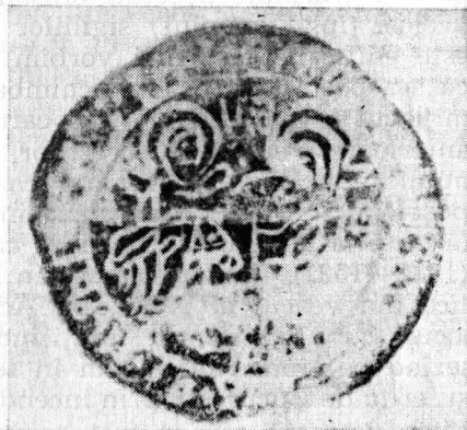
Pecetea orașului pe cartea din 18 iunie 1665 (7173) (Buna Vestire). Tipul II, varianta A.