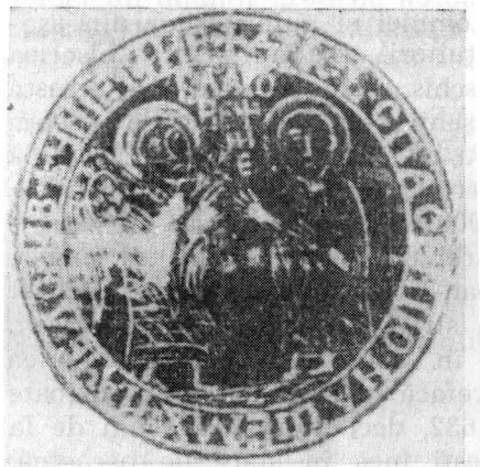
Pecetea orașului pe cartea din 12 iunie 1668 (7176) (Buna Vestire). Tipul II, varianta B.