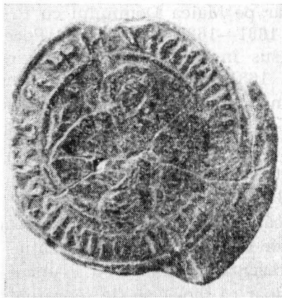
Pecetea orașului pe cartea din 9 ianuarie 1578 (7086) (Maica Domnului, bust, cu pruncul în brațe). Tipul I, varianta A.

Ne vom ocupa în considerațiile pe care intenționăm să le facem numai de imaginea religioasă centrală, neîntrînd în analiza celorlalte caracteristici, pentru care trimitem la studiile citate.