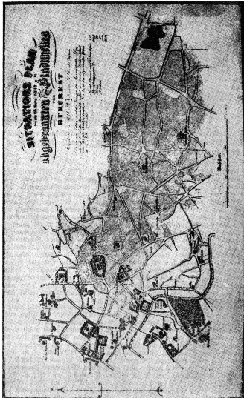
Fig. 1. Planul întocmit de Boroczyn, cuprinzând zonele oraşului mistuite de incendiul din 1847