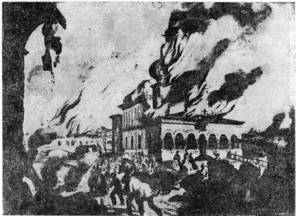
Fig. 2. Biserica Sf. Gheorghe Nou arzînd