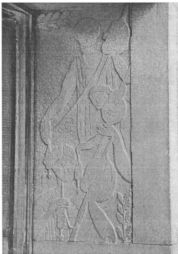
Detaliu – bazorelief de Milița Pătrașcu aflat la intrarea imobilului de pe strada Pictor Luchian nr. 3

Antiaeriene a Capitalei. În anul 1988, 7 apartamente aparțineau IAL-ului iar restul erau proprietăți particulare prin cumpărare sau moștenire.