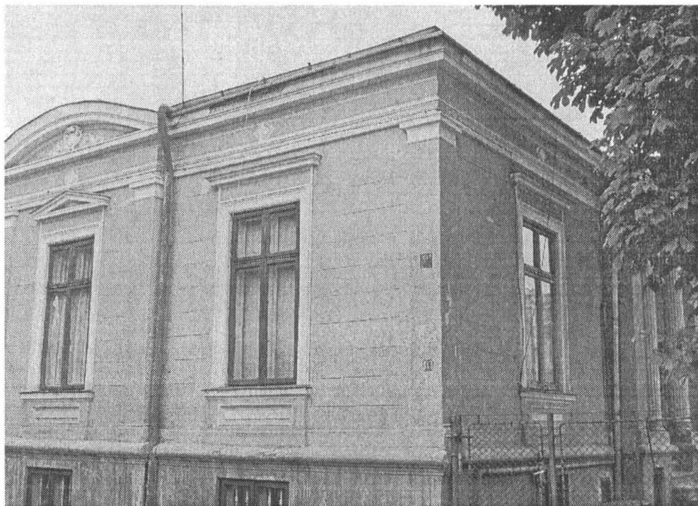
Casă stil neoclasic, Strada Pictor Ștefan Luchian nr. 11

La numărul 11 – construcție parter, din cărămidă cu acoperiș din tablă, în mai multe ape. Fațada principală care este spre curte are și intrarea în casă, sub forma