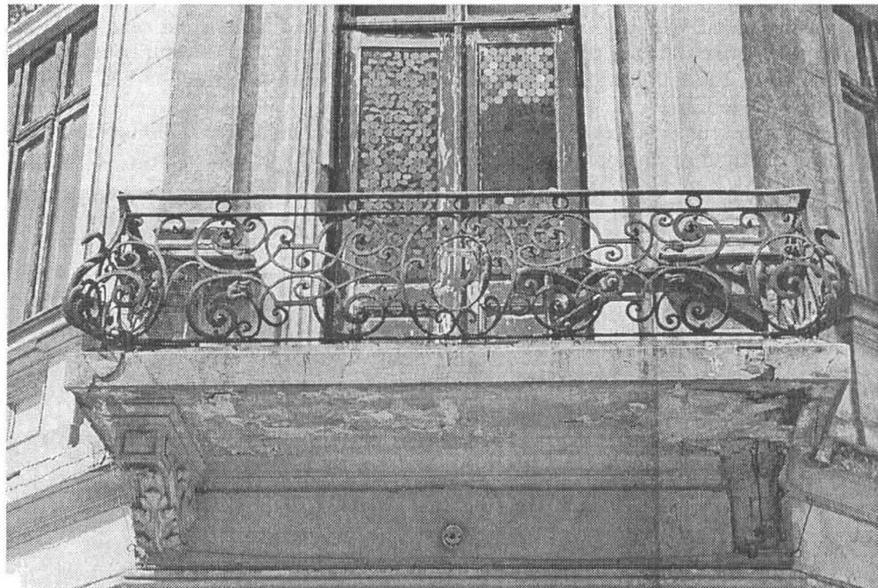
Detaliu balcon/feronerie – Str. Pictor Luchian