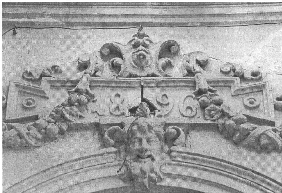
Detaliu fronton fațadă a clădirii de pe strada pictor Ștefan Luchian nr. 18

Deși din totalul caselor studiate pe teren avem o singură construcție, cea de la numărul 18, datată la sfârșitul sec. XIX, (având înscris anul 1896), aspectul mai multor imobile ne face să credem că ele datează din aceeași perioadă. Construcții obișnuite, fără a cunoaște numele arhitectului, iar dacă apar unele elemente decorative cum ar fi un cartuș cu elemente florale, o cornișă ornamentală, pervaze de ferestre pe console din zidărie, acestea se datorează fie gustului comanditarului fie prețperii meșterilor executați. Excepție de la aceste supoziții fac clădirile de la numerele 1; 3; 5; 7; 12; pe care le avem date din informațiile obținute de la Arhivele Orașului București, ca fiind construite la începutul secolului XX. La numărul 7 există în plus și datarea prin înscricționarea anului 1938 pe o placă alături de numele arhitectului Toma Marinescu.