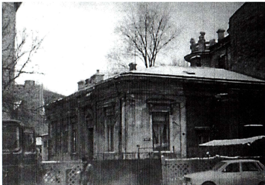
Strada Paleologu, nr. 26 – Casa construită în anul 1893.

Pe un teren de 540 m 2 , erau 2 case: corpul principal având 5 camere și dependințe, iar corpul secundar, o cameră, spălătorie și magazie, conform actelor de la dosar – construcțiile au fost realizate în 1893.