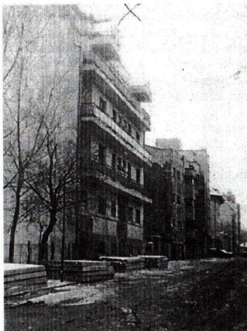
Strada Paleologu, nr. 3 – În acest bloc, a locuit scriitorul Panait Istrati (1934–1935).

Nr. 3 este un bloc cu parter și 5 etaje, din beton și cărămidă, cu acoperiș din tablă, în terasă. Clădirea are plan și deschideri rectangulare; intrarea principală