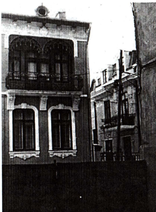
Strada Paleologu, nr. 8 – Imobil construit în anul 1908 (inscripție pe feronerie balconului).

La nr. 8 este o clădire parter și etaj, din cărămidă, cu acoperiș din tablă imitând ardezia, care este parțial în ape, parțial mansardat. Planul este în formă de „L”; are deschideri rectangulare și cu arce în plincintru și maner de cos. Pe partea sudică sunt două intrări. Cornisa este pe console din lemn și din zidărie în alternanță cu medalioane florale. Pe fațada estică se află un