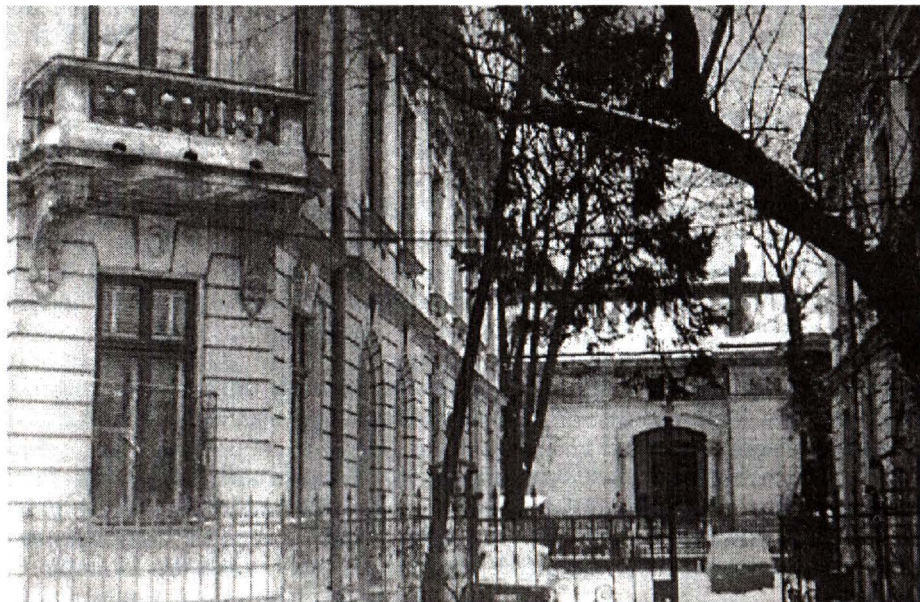
Strada Paleologu – nr. 18, 20 A, 20 B – Ansamblul de trei clădiri – arhitect Leopold Schindl.

Pentru cele trei imobile, avem date privitoare la succesiunea proprietății, în două dosare 23 de la Fondul cărții funciare.