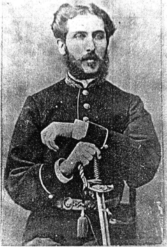
Oficiant clasa a V-a al Corpului Telegrafo-Poștal, mică ținută, model 1865, atelier fotografic necunoscut, Muzeul Municipiului București