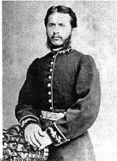
Controlor clasa a II-a în Corpul Telegrafo-Poștal, mare ținută, model 1865, foto M. Wolf, Galați, colecția autorului www.muzeulbucurestiului.ro , www.cimec.ro