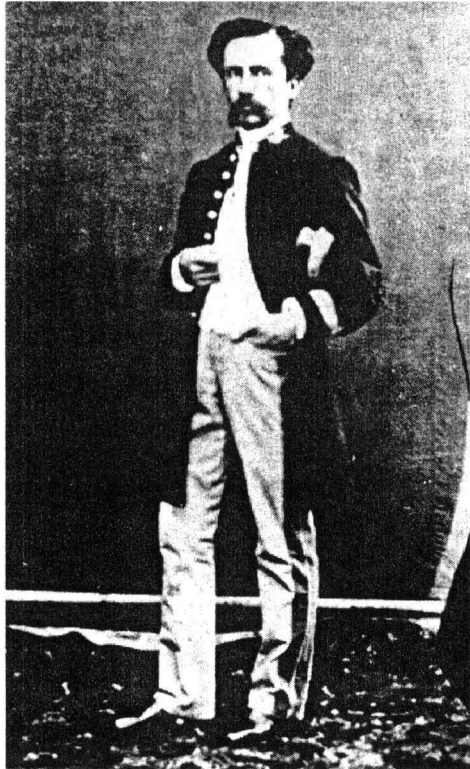
Șef de stație Telegrafo-Poștală clasa a IV-a, mică ținută, model 1865