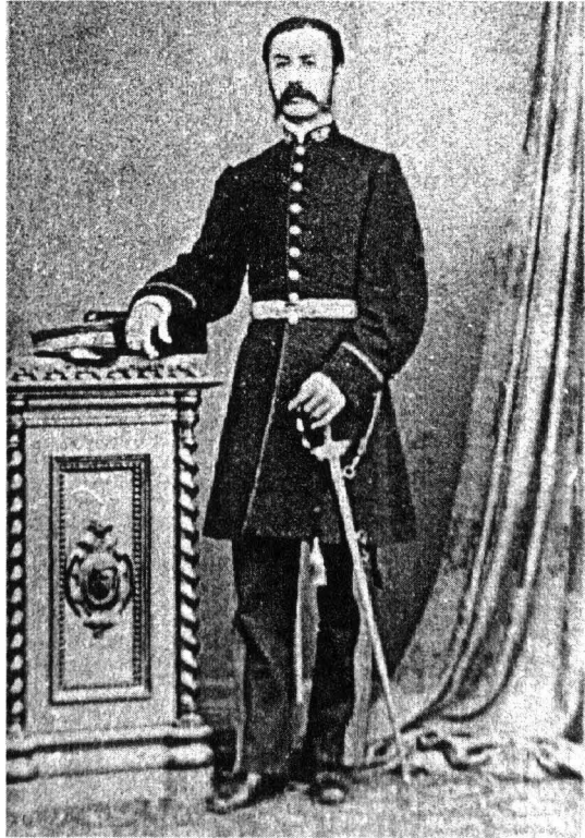
Ofițier clasa a V-a al Corpului Telegrafo-Poștal, mică ținută, model 1865, foto Franz Duscher, București, Muzeul Militar Național