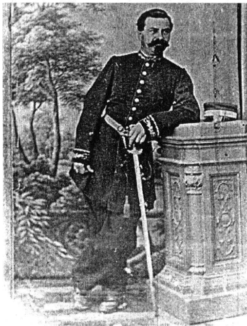
Șef de Stație Telegrafo-Poștală clasa a II-a cu tunică de mare ținută dar șapcă de mică ținută, model 1865, atelier fotografic necunoscut, Muzeul Militar Național