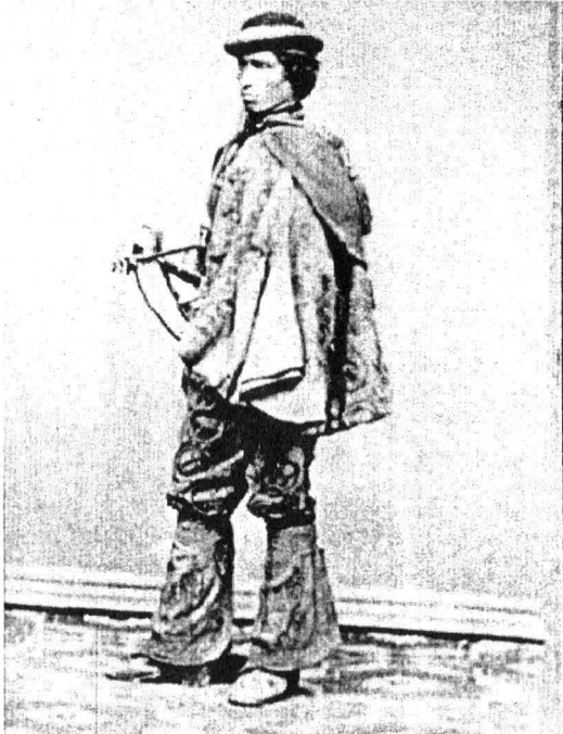
Surugiu, foto Carl Schäffer, Herculane, Biblioteca Națională