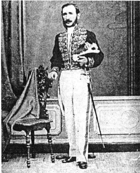
Magistrat la Curtea de Casație în ținută de ceremonie, model 1863, foto J. Marie, București, colecția autorului