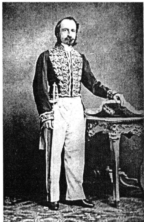
Magistrat la Curtea de Casație în ținută de ceremonie, model 1863, foto J. Marie, București, colecție particulară www.muzeulbucurestiului.ro / www.cinecra.ro , București, B.A.R.