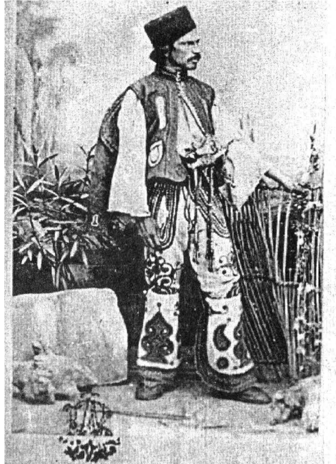
Surugiu, foto Carol Szathmari, București, B.A.R.