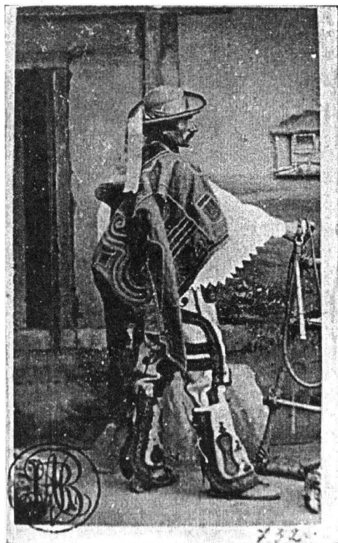
Surugiu, foto Carol Szathmari, București, B.A.R.