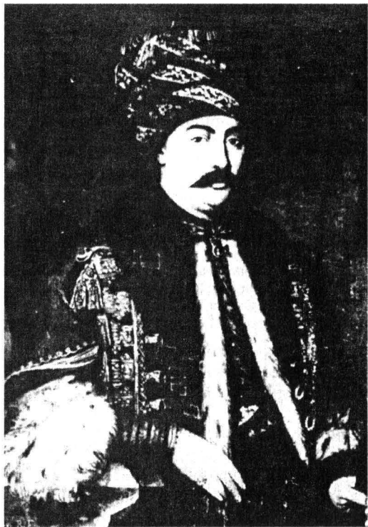
Manuc Bey (după un portret în ulci).