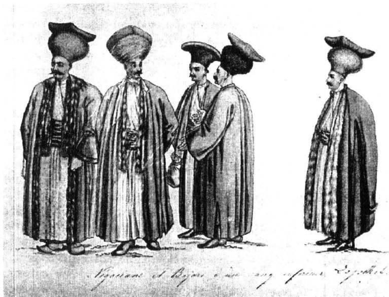
Negustori și boicrăși din București (după albumul lui August von Herilstern).