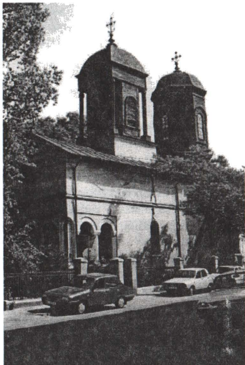
1. Biserica Negustori cu hramul Sfântul Nicolae.

După aceste nefericite întâmplări între 1725–1726 (în timpul domniei lui Nicolae Mavrocordat) în locul celei de lemn a fost construită o biserică din cărămidă care în forma exterioară se păstrează până astăzi.