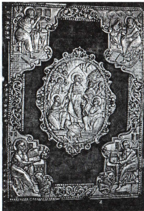
3. Evangheliar cu text grecesc și chirilic.

Evident de-a lungul timpului asupra clădirii au intervenit atât vremurile cât și oamenii. Dar eventualele reparații n-au mai fost menționate în documentele care ne-au stat la dispoziție. Cutremurul din 1977 a afectat grav biserica, dar deoarece întreaga zonă era cuprinsă într-un plan amplu de sistematizare nu s-au mai alocat fonduri pentru reparații și restaurări.