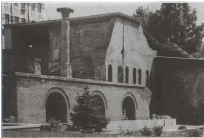
Palatul Voievodal- Curtea Veche

Factorul economic s-a împletit, în prima jumătate a secolului al XV-lea, cu o serie de evenimente politice, fapt pentru care a grăbit construirea și consolidarea noii așezări urbane de pe malurile Dâmboviței. Încă de la sfârșitul secolului al XIV-lea, în urma înfrângerii statului sârb și a țaratelor bulgare, își făceau apariția la Dunăre armatele statului militar feudal otoman. Voievodul Mircea cel Bătrân a fost primul