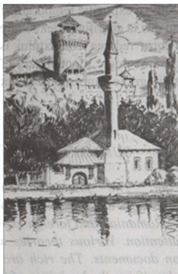
Geamia și cetatea lui Vlad Țepeș Desen în peniță, sec. XX

Cu ocazia primei atestări documentare a orașului București, Muzeul Municipiului București, organizează la palatul Suțu, în perioada septembrie-octombrie