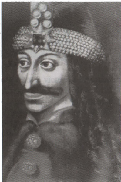
Voievodul Vlad Țepeș Portret în ulei din castelul Ambras, Tirol, Austria, sec. XV

Al. Lapedatu în lucrarea sa “Două vechi cetăți românești”, spune că, Vlad Țepeș (1456-1462; 1476) pentru a opri întrucâtva năvălirile turcilor face o întărire în ostrovul de la Comana, localitate la jumătatea drumului dintre Giurgiu și București. Tot el spune: “în a doua jumătate a veacului al XV-lea apare o altă cetate pe Dâmbovița în jos de locul de mai apoi al Bucureștilor, - acel < Castrum fluvii Dombovicha > numit pentru întâia oară în scrierile lui Țepeș către brașoveni (1460)”. Păreră lui Al.