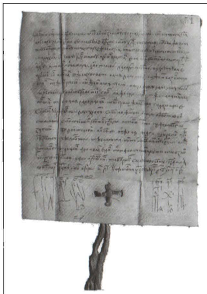
Prima atestare a Curții domnești din București Hrisov emis de Radu cel Frumos la 14 octombrie 1465

Iova și Drag cu ocazia întăririi occinelor acestora de la Ponor-Oltenia și a scutirii lor de obligațiile față de domnie: vama oilor, a porcilor, albinăritul, găletărit, vinărici, dijme, cositul fânului, posade, podvoade și cărături. În textul documentului așternut pe pergament în limba slavă, în redacție medio-bulgară, limba oficială a cancelariei Țării Românești se menționează că s-a “scris în septembrie 20 în cetatea București, în anul 6968” (1459), semnalându-se astfel îndiscutabil existența, la acea dată, a Bucureștilor. Hrisovul din 20 septembrie 1459 a fost descoperit, la începutul secolului XX, de către învățătorul Alexandru Bunceanu din comuna Nadanova,