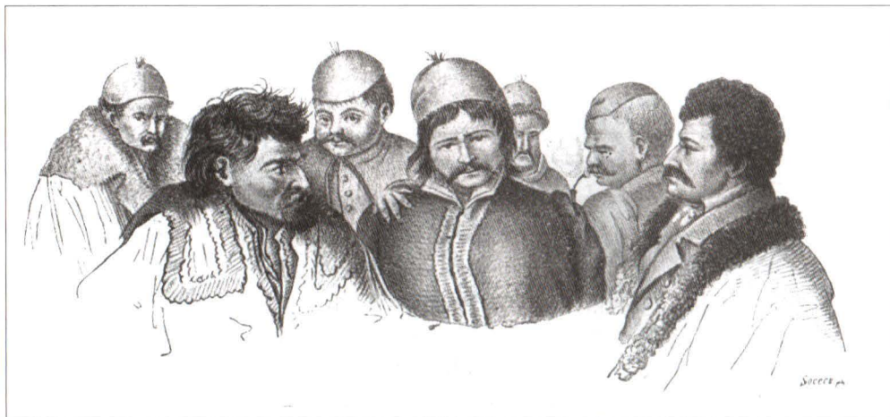
Soldați eteriști de la 1821