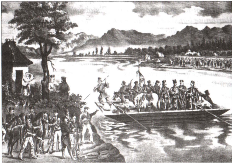
Panduri trecând Oltul la 10 martie 1821 Litografie, sec. XIX