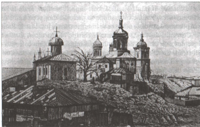
Biserica Bucur și Mănăstirea Radu Vodă la 1881, după dărâmarea zidului de incintă mănăstiresc

În ceea ce privește stilul arhitectural al lăcașului, acesta se încadrează tipologic după specialiști 12 veacului fanariot, cu precizarea că forma acoperișului turlei e unică din punct de vedere constructiv printre ctitoriile similare din capitală; transpunerea canoanelor arhitecturale ortodoxe în cărămidă și piatră s-a făcut în cazul acestui lăcaș de cult cu economie de mijloace, o posibilă indicație a rolului său marginal în viața comunitară monahală. Astfel e vizibilă, de pildă, substituția pronaosului prin pridvorul de lemn andosat fațadei principale și o deplină refuzare a oricărui element de podoabă, ab initio , de exemplu ciubucul sculptat de pe fațadă și ancadramentele sculptate ale ferestrelor; actualele ancadramente datează din anul 1910, fiind datorate atenției la detalii a arhitectului-restaurator Grigore Cerkez. Tencuiala albă care e