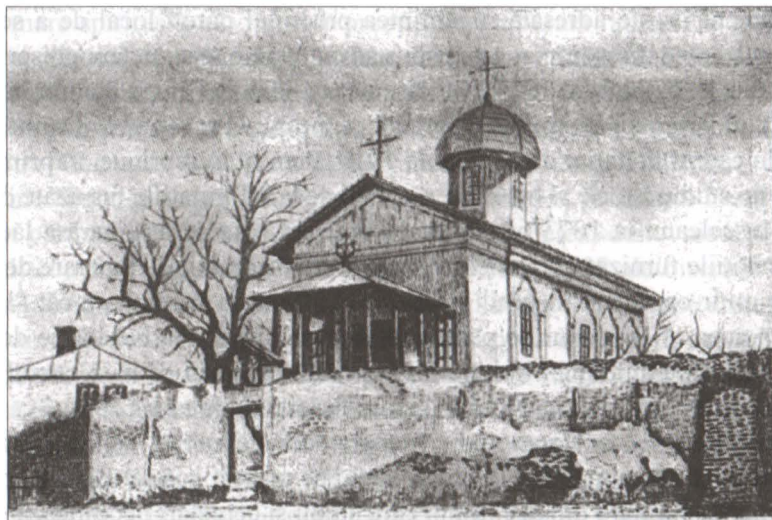
Biserica Bucur la 1882

dorea să știe desigur modul în care aveau să-i fie cheltuiți banii.