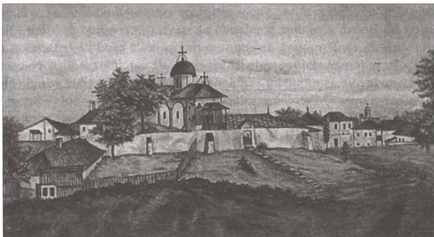
Biserica Bucur la 1856

Biserica zisă “a lui Bucur Ciobanul” ori “Biserica Sf. Atanasie ce este afară de curtea Mănăstirii [Radu Vodă]” așa cum apare într-o catagrafie datată 1 mai 1853 1 este conform unei legende ctitoria ciobanului Bucur, fondatorul orașului București pe malul unei ape curgătoare, în locuri numai bune de pășunat. Prima mențiune scrisă a legendei lui Bucur și a ctitoriei sale apare în cartea istoricului sas Johann Filstich, “Tentamen Historiae Vallachicae” 2 publicat în 1728. În Cartea I, capitolul V e scris