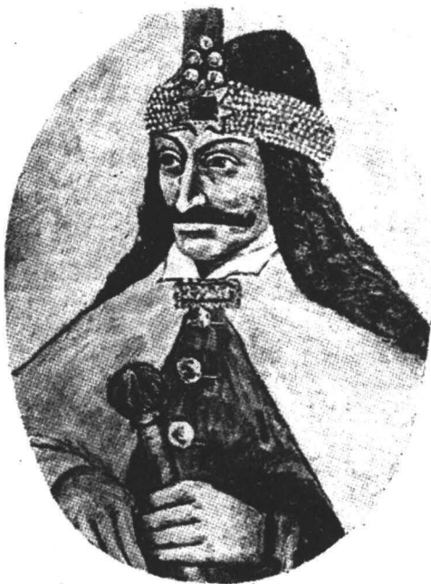
Vlad Țepeș (1456-1462), citorul Cetății Bucureștiului

Promovând o politică supusă intereselor Porții otomane, Radu cel Frumos și-a stabilit reședința domnească la București, spre deosebire de înaintașii săi, care au