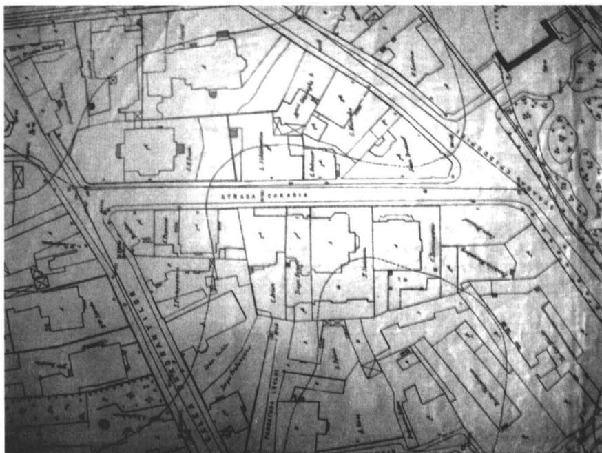
Planul Cadastral al Armatei 1895-1899, detaliu, Colecția Hărți și Planuri a M.M.B

Confuzia era înlăturată, iar strada primea numele de Corabia.