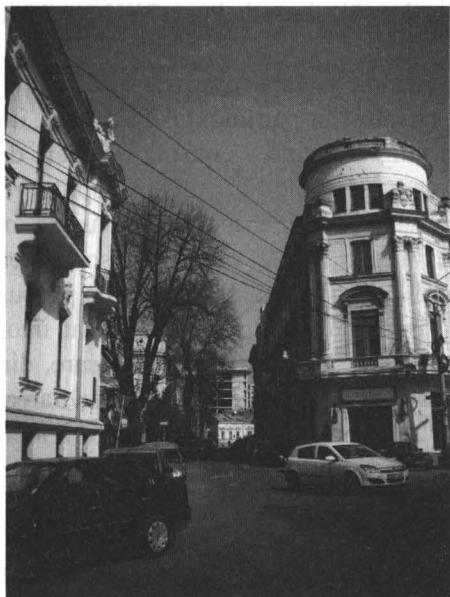
Strada Georges Clemenceau, văzută din strada Constantin Esarcu