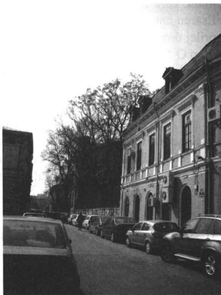
Strada Georges Clemenceau, văzută din strada Compozitor George Enescu