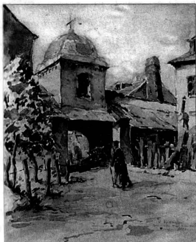
Clopotnița Bisericii Manea Brutaru

Prin introducerea clopotelor în cult, s-a făcut necesară construirea unor turnuri-clopotniță, adică încăperi anumite pentru instalarea clopotelor. Atunci când aceste încăperi constituiau clădiri separate de edificiul bisericii (dar totdeauna în apropierea ei) clopotnițele aveau de obicei forma de turnuri înalte, circulare sau poligonale, mai rar dreptunghiulare, fiind făcute din zid sau din lemn. Clopotul era atârnat la înălțime pentru a putea fi auzit la mari depărțări, de aceea camera lor are în general, forma de foișor deschis din toate părțile. În Nordul Transilvaniei, încă dinainte de secolul al XIII-lea, existau astfel de turnuri clopotnițe în Cuhea, Ieud,