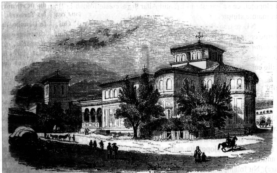
Tipăritură Biserica cu clopotnița Sf. Gheorghe din București – după M. Bouquet

Se continuă cu rostirea Psalmului 28, apoi cu o Rugăciune de sfințire, prin care Preotul se roagă pentru a se vărsa în el darul dumnezeiesc, ca auzind credincioșii glasul sunetului lui, să se întărească în evlavie și în credință și bărbătește să se împotrivească tuturor asupririlor diavolești și, prin rugăciuni neîncetate și slavă aducând Ție, Adevăratului Dumnezeu, să le biruiască și la biserică spre rugăciunea și slava sfântului Tău nume, ziua și noaptea, cu grăbire să alerge 19 . Preotul slujitor, ia aghiasmă, stropește clopotul din patru părți pe din afară, și mergând împrejurul lui zice: Se binecuvântează și se sfințește clopotul acesta prin stropirea cu această apă