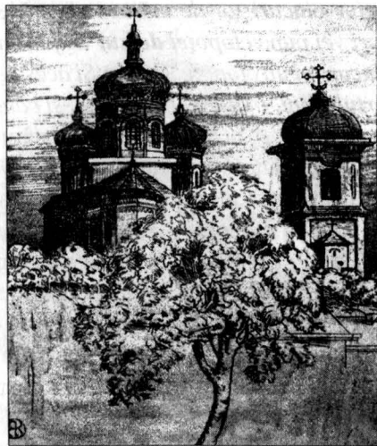
Gravură M-reșă Radu Vodă A. Kaindel

Giulești, Văleni, Apșa, Biserica din Streiul Hunedoarei ș.a. În Principatele Române printre primele mănăstiri care au avut turn clopotniță amintim Mănăstirea Cotmeana și Bistrița din Moldova. Multe din ctitoriile lui Ștefan cel Mare s-au bucurat de clopotnițe, menționând aici M-reșă Sf. Nicolae din Popăuți, M-reșă Probota, Biserica din Părâuți sau Mănăstirea Putna cu deja cunoscutul clopot cel mare numit Buga (1482) care cântărește 1.565 kg. 15 Pe raza orașului București, cele mai vechi clopote se găsesc la Bisericile Sf. Ilie Gorgani din 1701-1702, la Biserica Dintr-o zi (1703-