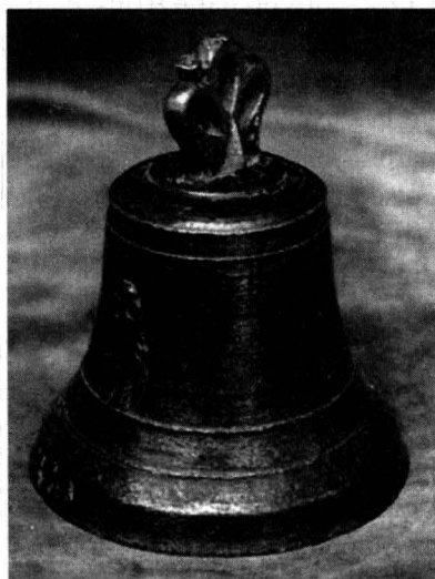
Clopot sec. XIX Colecția M.M.B.

Creștinii au respins într-o primă fază clopotele, considerându-le legate de religiile de mistere și cultele păgâne. Până în secolul al IV-lea anunțarea serviciilor religioase erau făcute de diaconi. Actele martirice din Africa Proconsulară din