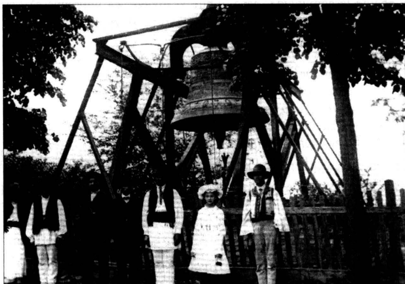
Oameni din popor alături de Clopotul cel mare din dealul Patriarhiei - sf sec. XIX 23*

Din 1931, datorită lucrărilor de sistematizare a zonei, clopotul a fost demontat de pe eșafodul său și ținut în parc fără vre-o folosință. Abia în 1958, când s-a restaurat și rezidit nivelul superior al clopotniței, Patriarhul Justinian a instalat cele 5 clopote în turn pe un schelet metalic și s-a montat o instalație electro mecanică de acționare. Aceste clopote, aproape un secol i-au anunțat pe bucureșteni și au fost martore la întronizările Mitropoliților și Patriarhilor, la moartea acestora; la investirea domnilor Țărilor Românești și nu numai. Din 2008 însă, urmau să „predea ștafeta” unei noi generații de clopote, fabricate de vestita familie Grassmayr, care are o vechime în domeniu, de mai bine de 400 de ani. Clopotele vechi au fost dăruite Mănăstirii Cernica.