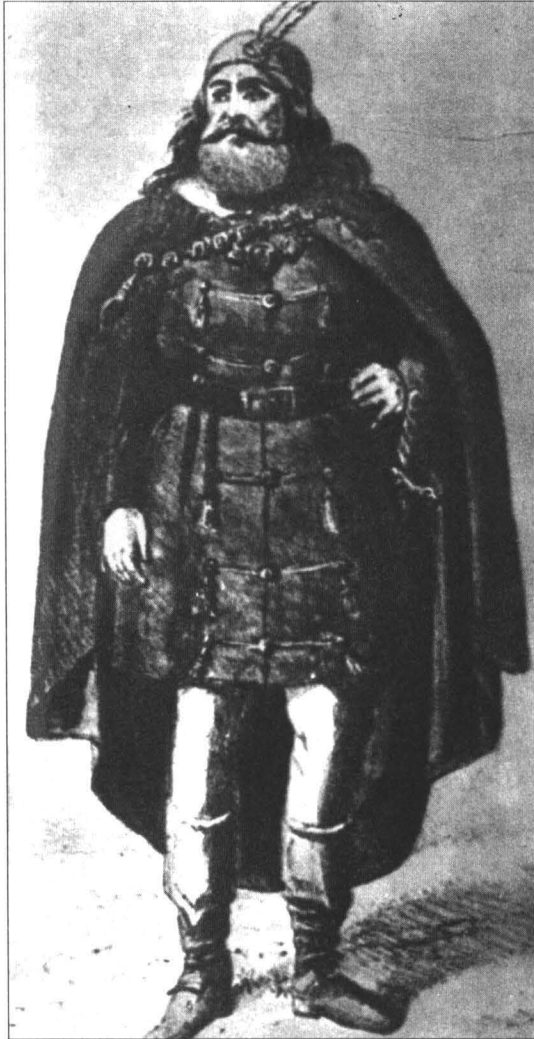
Comandant din oastea călare, litografie de Gh. Asachi