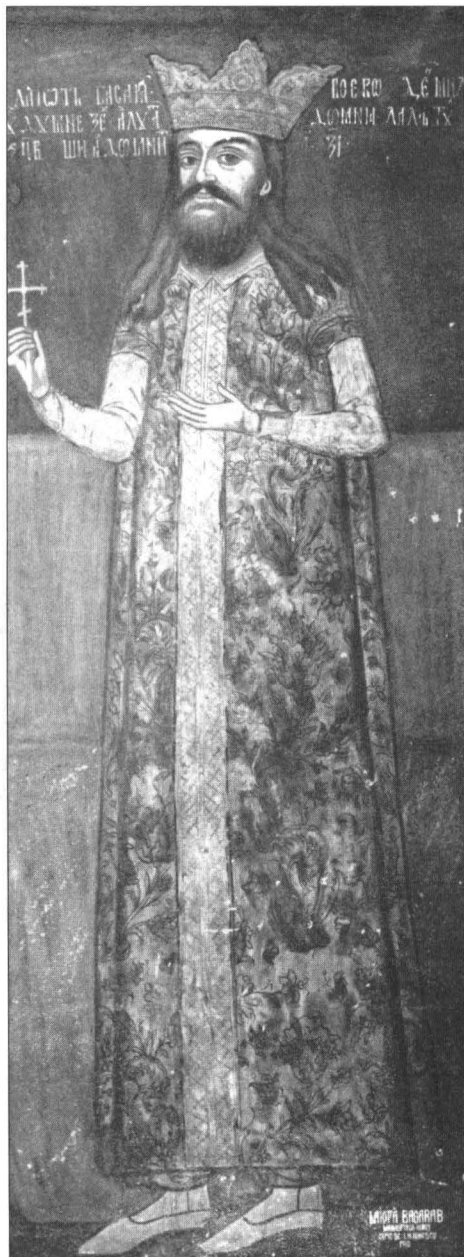
Laiotă Basarab (1473-1477), domn al Țării Românești, după fresca de la Hurezi, sec. XVII