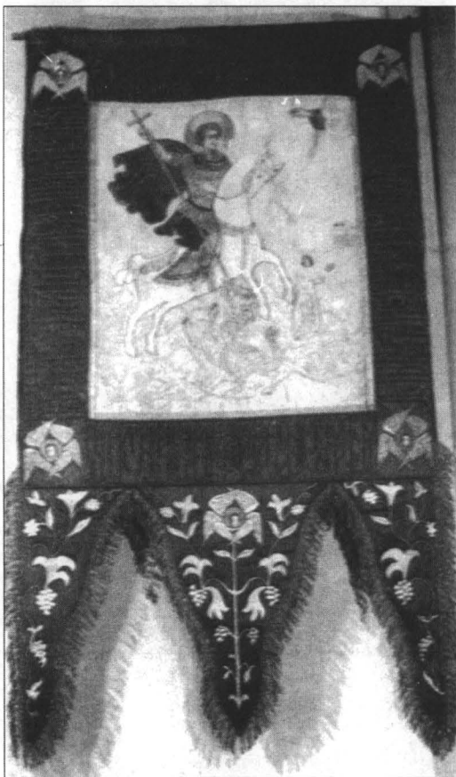
Steag din timpul lui Ștefan cel Mare