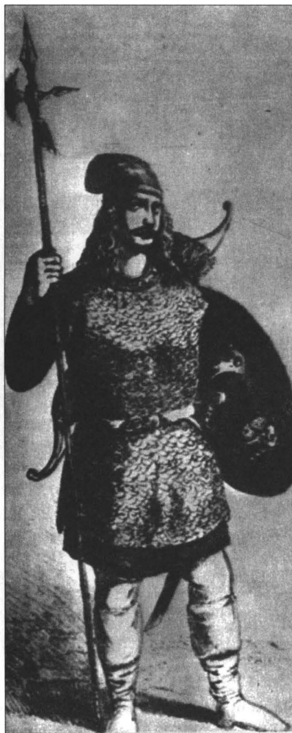
Ostaș moldovean din pedestrimă, litografie de Gh. Asachi