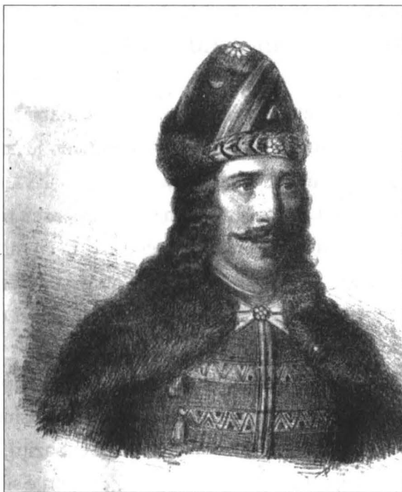
Vlad Țepeș, litografie de A. Bieltz