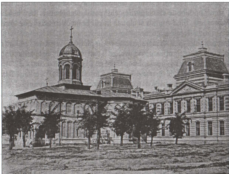
Biserica și Spitalul Colței, Litografie Colecția Tipărituri și Imprime a M.M.B.