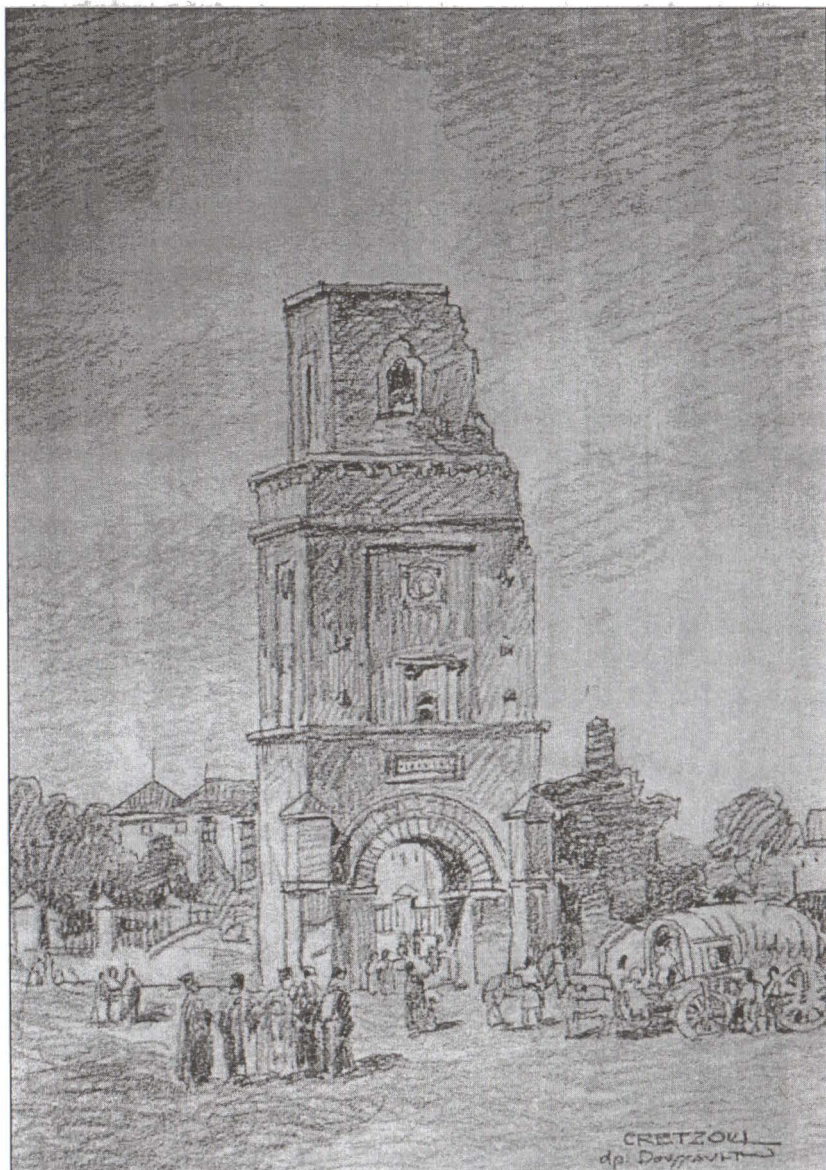
Turnul Colței, Desen, semnat dreapta jos Cretzoiu dp Doussault Colecția Artă Plastică a M.M.B.