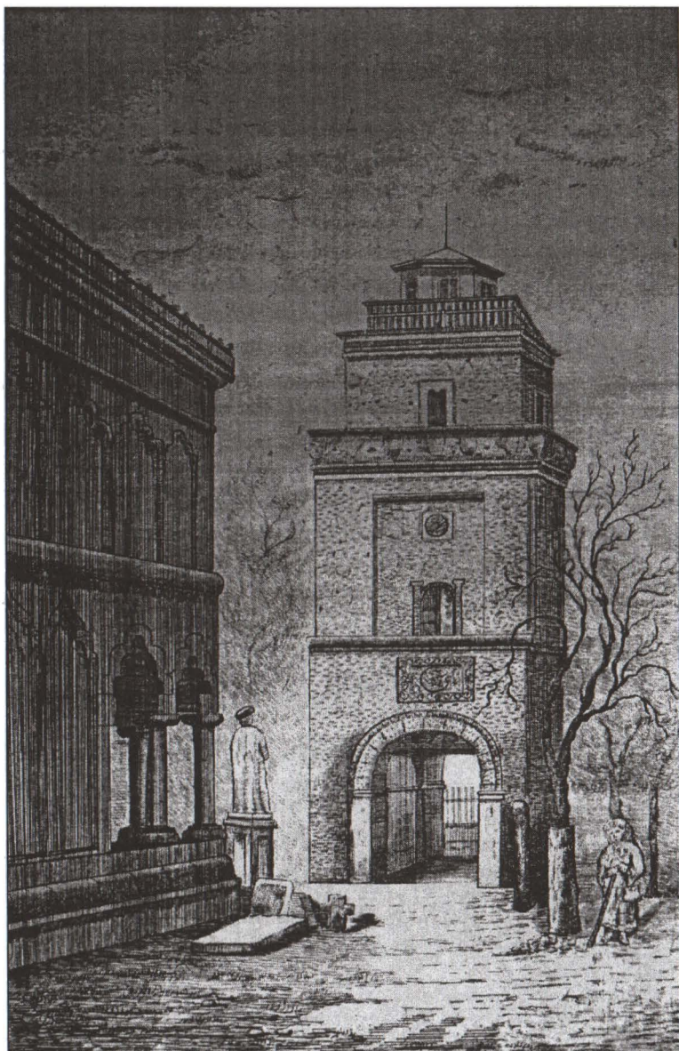
Turnul Colței, Gravură Colecția Tipărituri și Imprime a M.M.B.