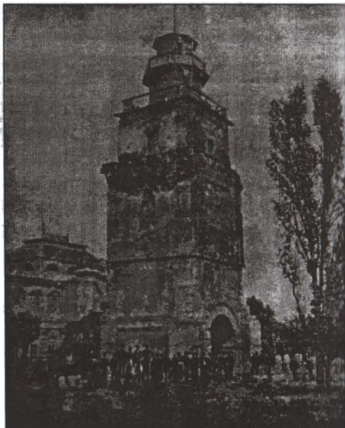
Turnul Colței, Litografie, Colecția Tipărituri și Imprimare a M.M.B.

stătea de veghe un pompier care imediat ce observa foc în vreo parte a orașului anunța pe cel de jos și acesta la rîndul lui unitatea respectivă, care și pornea în modul