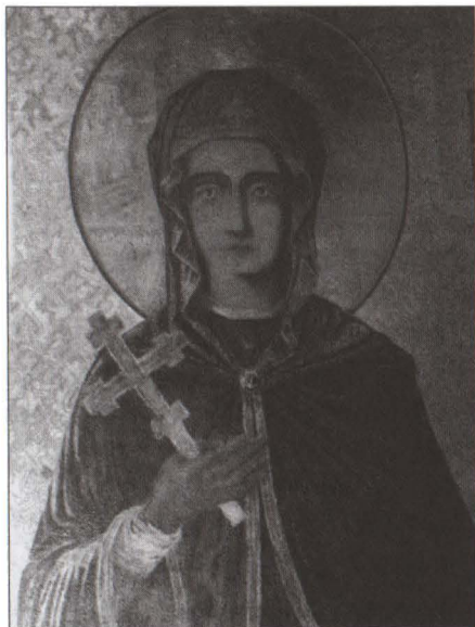
Fig. 3 detaliu din portretul icoanei sfintei Parascheva