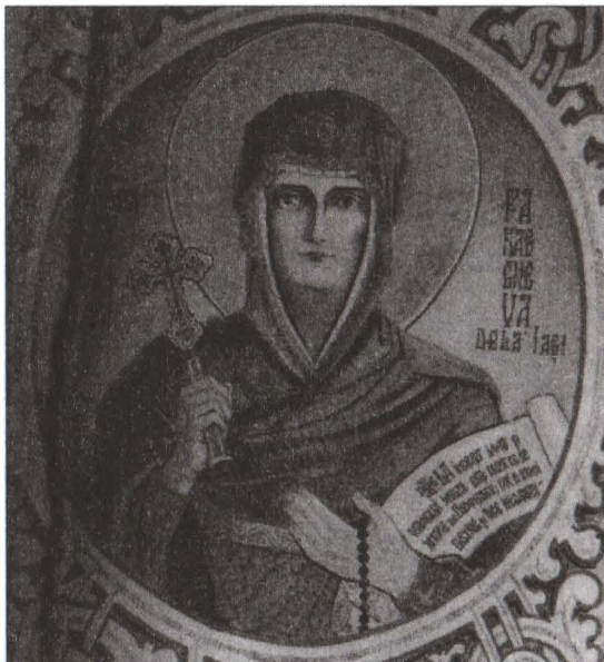
Fig. 4 detaliu din icoana Sfântei Parascheva de la Iași, icoană aflată în biserica Sfântul Anton din București