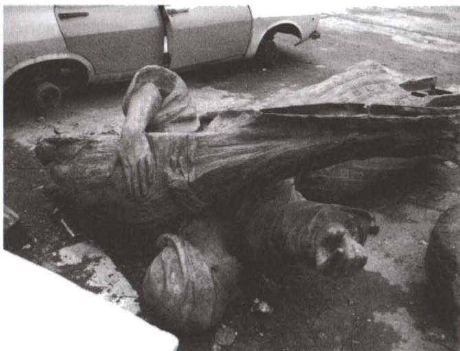
Monument "Lascăr Catargiu"- autor Jean-Marius Antonin Mercié Personaj feminin cu spice - Combinatul Fondului Plastic - 02.02.2009