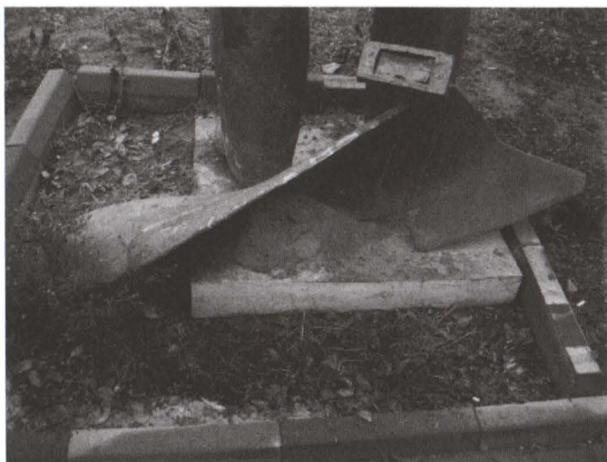
Monument "Lascăr Catargiu" - autor Jean-Marius Antonin Mercié Componentă plaj - Combinatul Fondului Plastic - 02.02.2009