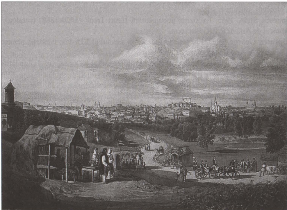
Carol I pe câmpul libertății – Carol Popp de Szathmari