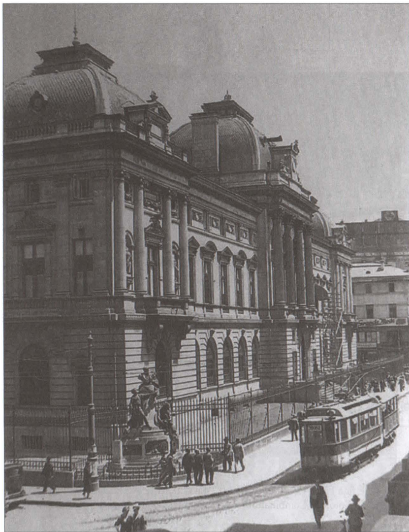
București, alveola din curtea B.N.R. la intersecția străzilor Lipscani și Eugeniu Carada unde în 1924 a fost dezvelit monumentul dedicat cinstirii finanțistului Eugeniu Carada, lucrare concepută și modelată de sculptorul Ernest Dubois, montată în România de către fostul său elev Dimitrie Mățăuanu.