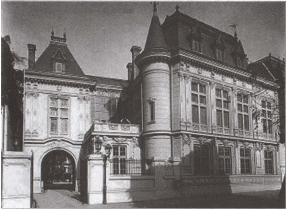
Monumentul fusese amplasat în imediata apropiere a casei Tache Ionescu Edificată la 1888 = ?