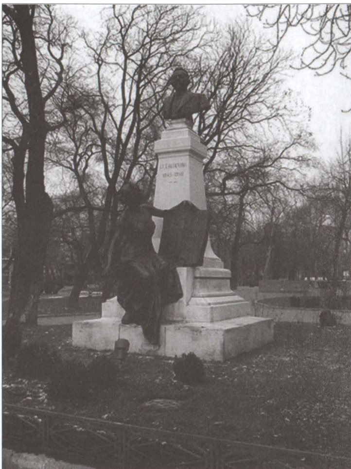
Monumentul G.C. Cantacuzino (1845-1898) modelat de sculptorul Ernest Henri Dubois. După turnarea în bronz a pieselor artistice a fost amplasat în București în zona nordică a Grădinii Icoanei. Pana pe care personajul feminin o ținea în mâna dreaptă, în 1904, la inaugurarea monumentului, a dispărut între timp.