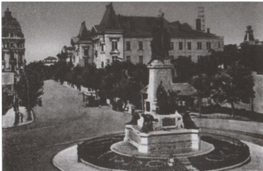
București, la intersecția celor două mari axe rutiere ale Capitalei amplasamentul monumentului Ion C. Brătianu. Componentele care au fost integrate fațadei cu deschidere spre est.