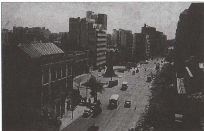
Ambientul în care a fost amplasat monumentul Tache Ionescu