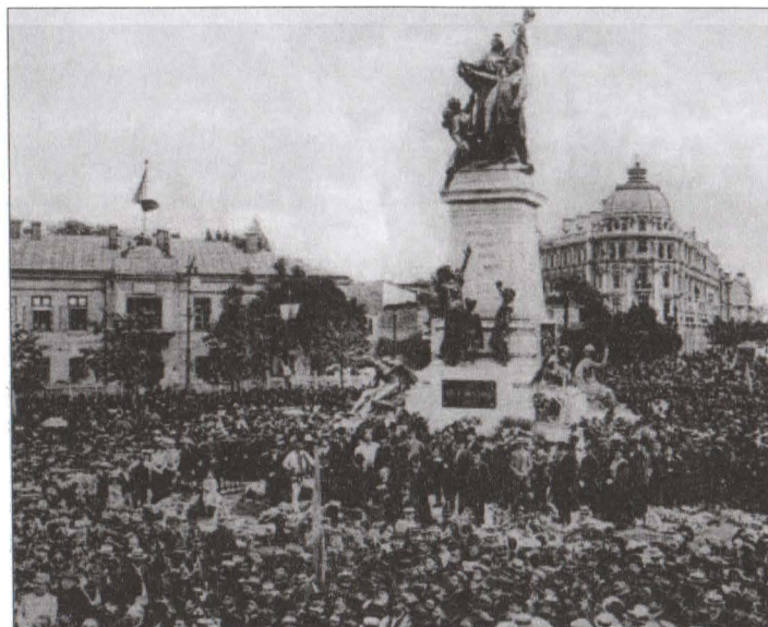
București, 1903 – solemnitatea inaugurării monumentului Ion C. Brătianu