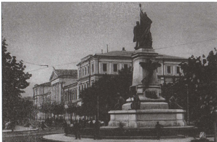
Componentele care au fost integrate fațadei cu deschidere spre vest.