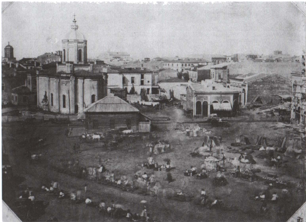
Ludwig Angerer, Piața Sfântul Anton, foto sepia, 1856. (inv 10.792)