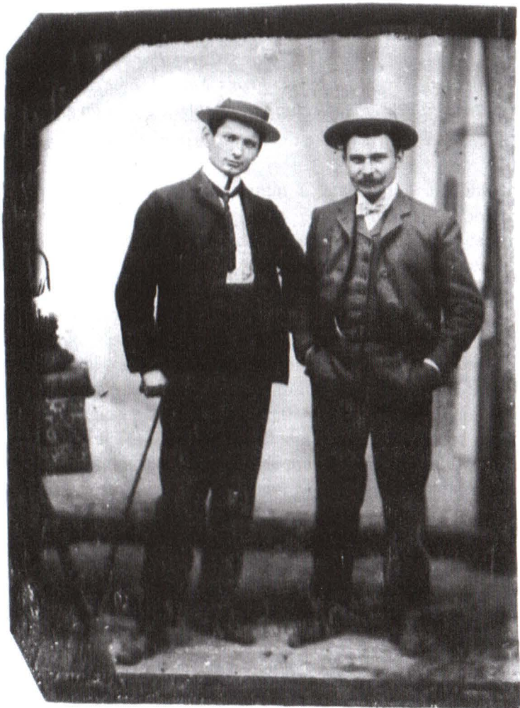
Două personaje masculine în picioare, ferotipie, după 1860 (inv.135.818)