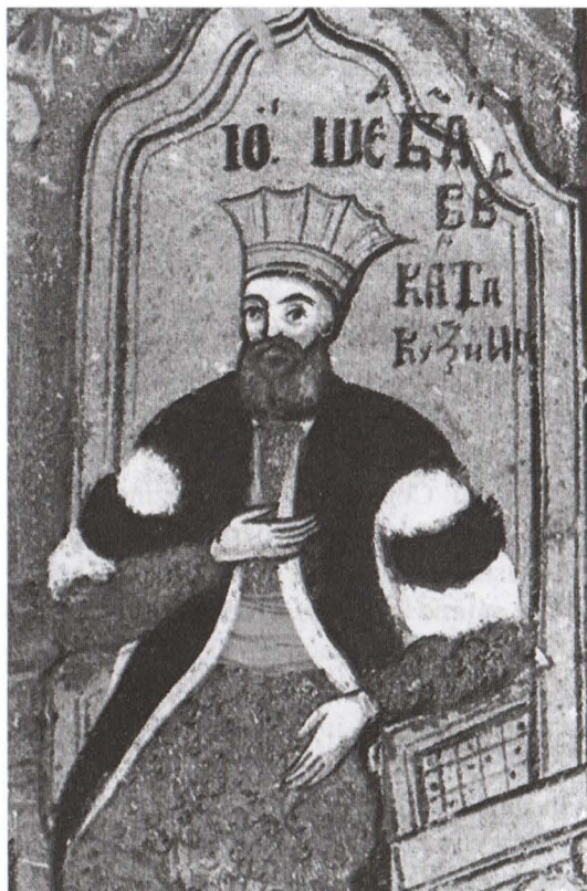
Șerban Cantacuzino, domnitorul Țării Românești (1678-1688)

în timpul lui Mircea Ciobanul (1545-1554; 1558-1559) într-un Palat domnesc, care, cu reparații și adăugiri de noi corpuri, s-a păstrat până către a doua jumătate a secolului al XVII-lea și în prima parte a veacului următor, când Curtea Domnească a Bucureștiului a cunoscut trei etape de extindere 2 . Acestea s-au concretizat prin remodelarea cu rafinament a clădirilor ocupate de domn, de instituțiile domniei și de familia lui. Așadar, vorbim despre o operă ctitoricească realizată de către Șerban Cantacuzino, Constantin Brâncoveanu și Ștefan Cantacuzino 3 .