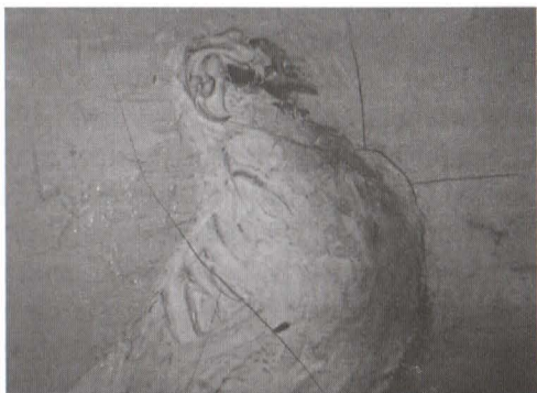
Micro 30X, înainte de restaurare