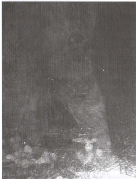
Detaliu, reflectografie în infraroșu, NIR 3