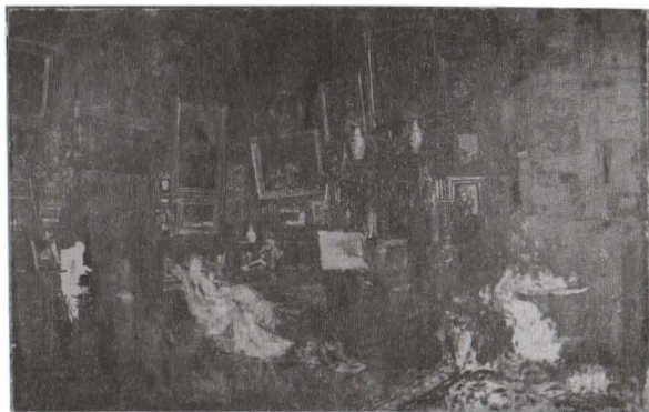
Ansamblu, lumină ultraviolet înainte de restaurare

Microscopia ne arată, pe lângă ductul pensulației și maniera alertă de așezare a materiei picturale, modul în care au reacționat în timp straturile picturale de preparare și culoare în zonele în care suprapunerile de straturi s-au făcut după uscarea primară a culorii de început. Craclurile de bătrânețe dure, tăioase și puternice, specifice picturii secolului XIX pentru zonele în care s-au folosit de către artiști pânze preparate în comert, achiziționate de la furnizorii austrieci, tendință de clivaj în straturile de