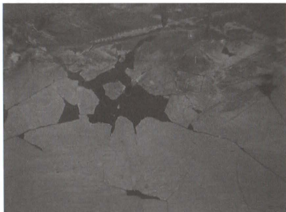
Detaliu, înainte de restaurare, lacune ale stratului de culoare

La studiul picturii cu aparatul de reflectografie în infraroșu se pot pune în evidență straturile intermediare ale picturii, dincolo de straturile de acoperire și de imaginea picturii așa cum o cunoaștem. Lucrarea Cireșe ne-a oferit o asemenea surpriză. Dezvăluirea portretului unui personaj feminin pictat de Theodor Aman în alte lucrări ale sale, portret la care a renunțat pentru a se apleca către o altă temă este încă un element de informație tehnică ce se adaugă la încercarea de a înțelege, măcar în parte, parcursul de pictor al lui Theodor Aman. Acest caz nu este singular în opera lui Aman fiind întâlnit în foarte multe dintre creațiile sale.