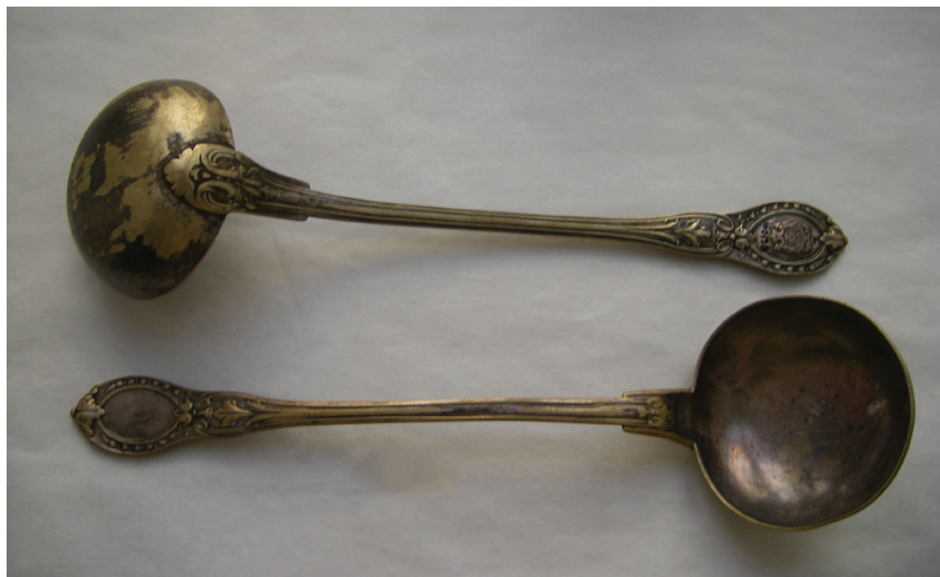
Fig. 12 Polonice nr. inv. 160.197-160.198