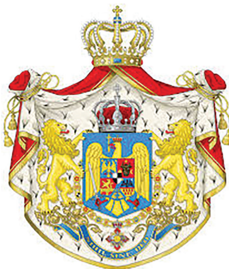
Fig. 6 Stema Romaniei Mari, 1921-1947