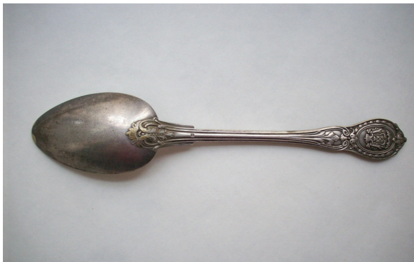
Fig. 13 Lingură nr. inv. 47.738-47.740