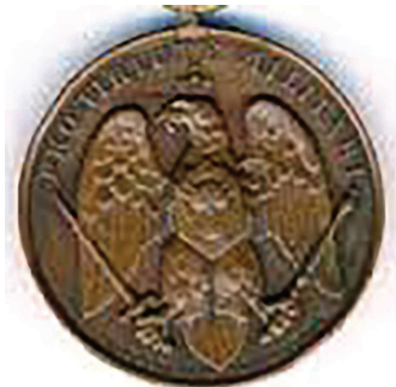
Fig. 1 Prima decorație instituită de domnitorul Alexandru Ioan Cuza