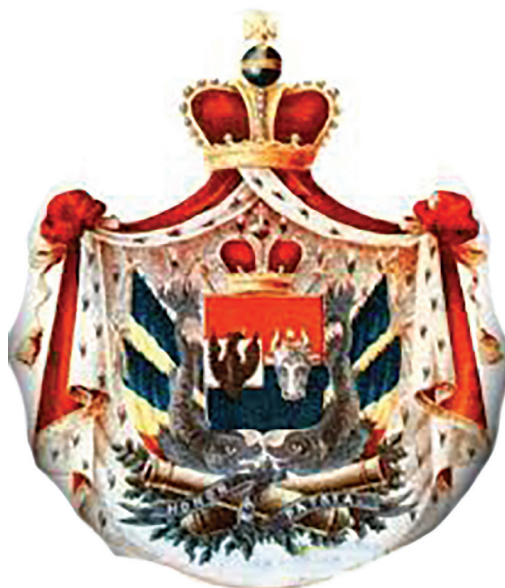
Fig. 2 Stema Principatelor Române, 1860