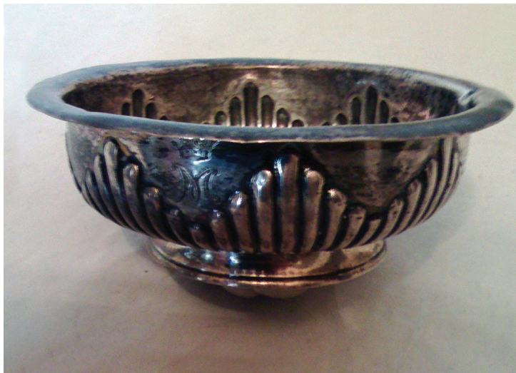
Fig. 19 Zaharniță nr. inv. 167.640