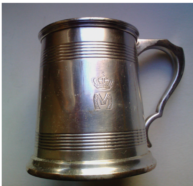
Fig. 20 Cană de lapte nr. inv. 167.646