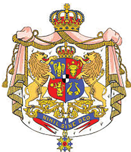
Fig. 5 Stema Principatelor Române, 1872-1921