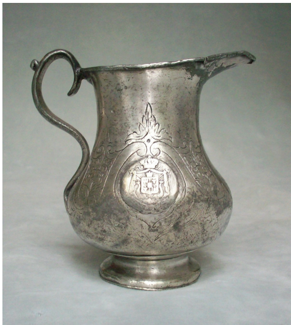
Fig. 8 Letieră nr. inv. 160.307-160.308