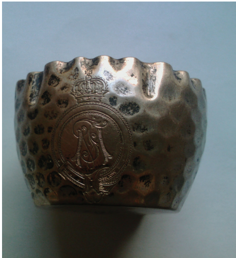
Fig. 17 Solniță nr. inv. 167.053- 167.057