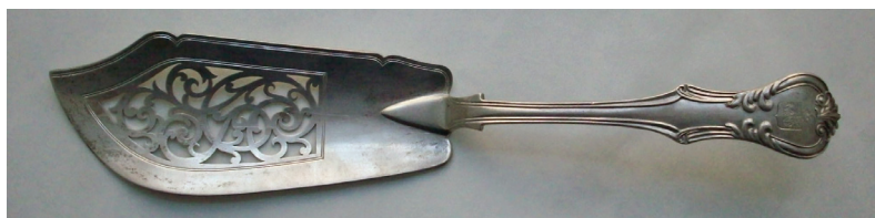
Fig. 11 Paletă pentru tort nr. inv. 47.735-47.737