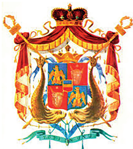
Fig. 3 Stema Principatelor Române, 1863