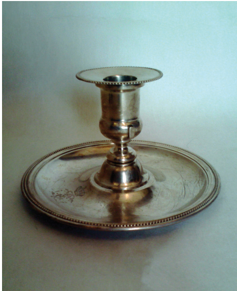
Fig. 15 Sfeșnic de cameră nr. inv. 160.314