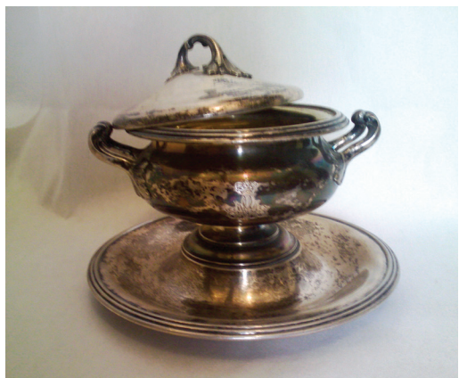
Fig. 18 Legumieră nr. inv. 167.706