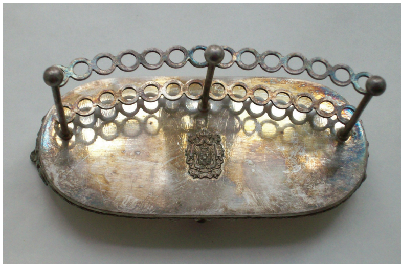
Fig. 9 Suport tacâm nr. inv. 47.523-47.552