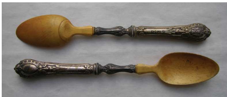
Fig. 10 Lingură nr. inv. 160.319