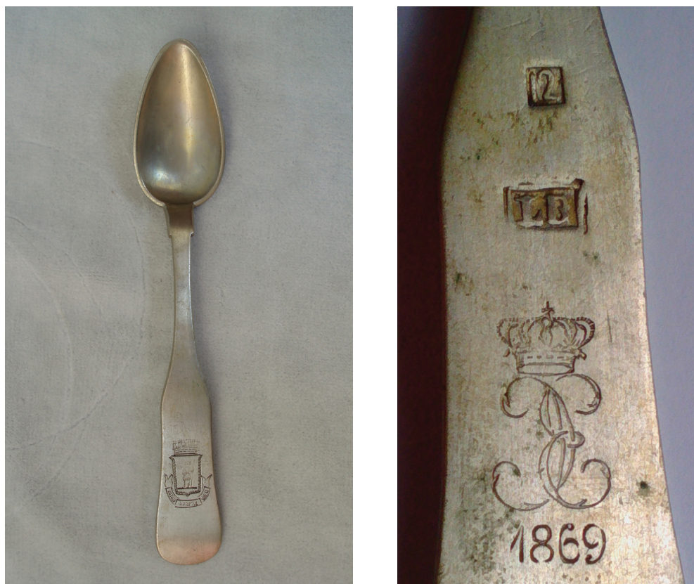
Fig. 14 a și b Lingură jubiliară nr. inv. 17.396