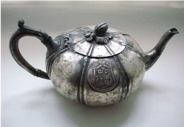
Fig. 7 Ceainic nr. inv. 160.295-160.305