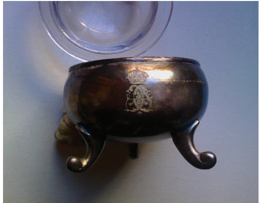
Fig. 16 Solniță nr. inv. 163.066