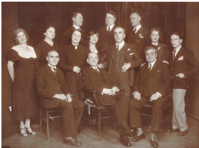
Fig. 1 Maestrul Nottara în mijlocul foștilor săi studenți la Sărbătorirea a 20 de ani de la absolvirea Conservatorului (1933)

adunate într-un manuscris în anul 1936 și publicate de Tatiana Nottara și Ioan Massoff sub titlul „ Amintiri ”. Cartea, relatează toate momentele decisive în care s-a întâlnit cu arta teatrală și felul în care a evoluat în cultivarea și dezvoltarea talentului său actoresc încăpătător.